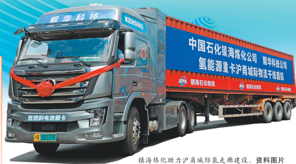
镇海炼化助力沪甬城际氢能走廊建设。资料图片