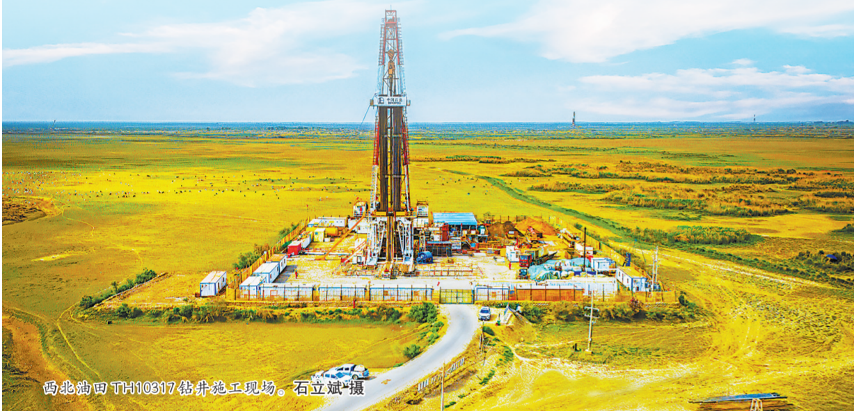
西北油田T410317钻井施工现场。

通过实施“质量加密”调整,中国石化老油气田在“十四五”期间每年新建原油产能约150万吨,占常规原油新建产能的55%以上,有力支撑了原油产量稳定。从“数量加密”到“质量加密”,不仅是井网形态和技术手段的升级,更是老油气田二次创业中开发思维方式的深刻转变,将曾经的“产量包袱”转化为“效益富矿”。展望未来,随着地质工程一体化的不断深入和数智化技术的全面赋能,井网调整必将为老油气田高质量开发注入更加强劲动力。