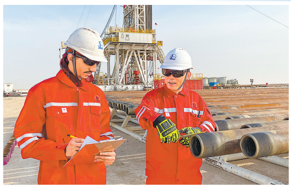
左图为沙特公司 SP-99 队中外员工检查钻具。 右图为沙特公司非常规气井 SP-26 队施工现场。