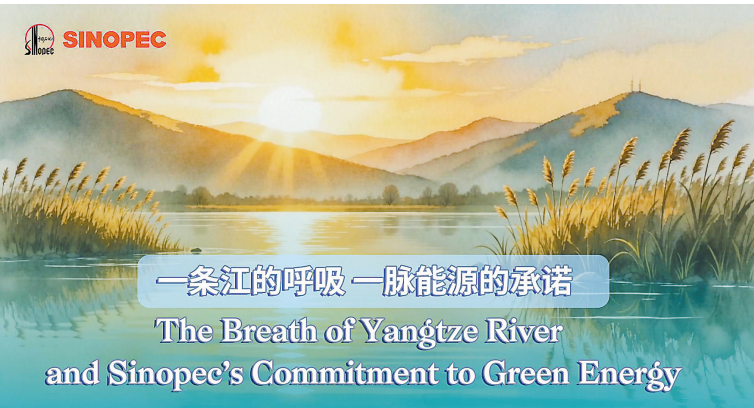
一条江的呼吸 一脉能源的承诺 The Breath of Yangtze River and Sinopec's Commitment to Green Energy