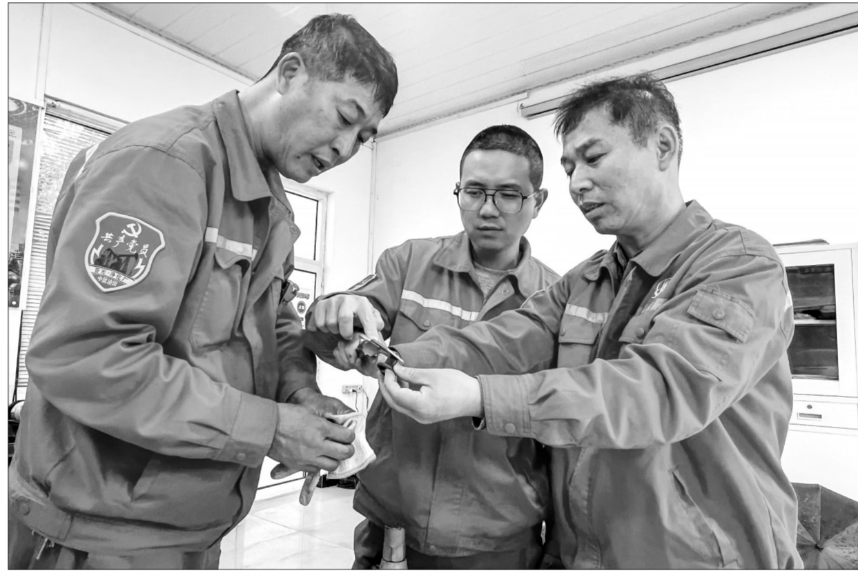
党员攻关解难题 根治疏水阀“跑冒滴漏”

日前,中原油田普光天然气净化厂公用工程车间党支部成立党员技术攻关队,针对全厂中压蒸汽管网疏水阀漏量偏大、阀芯冲蚀问题,进行解体攻关。他们通过改进阀芯结构、提升耐冲刷性能,解决了疏水阀“跑冒滴漏”问题,根治了因阀芯过大造成大量蒸汽排放浪费的问题。图为5月26日,攻关队成员分析被损坏阀芯的原因,探讨阀芯改进方法。