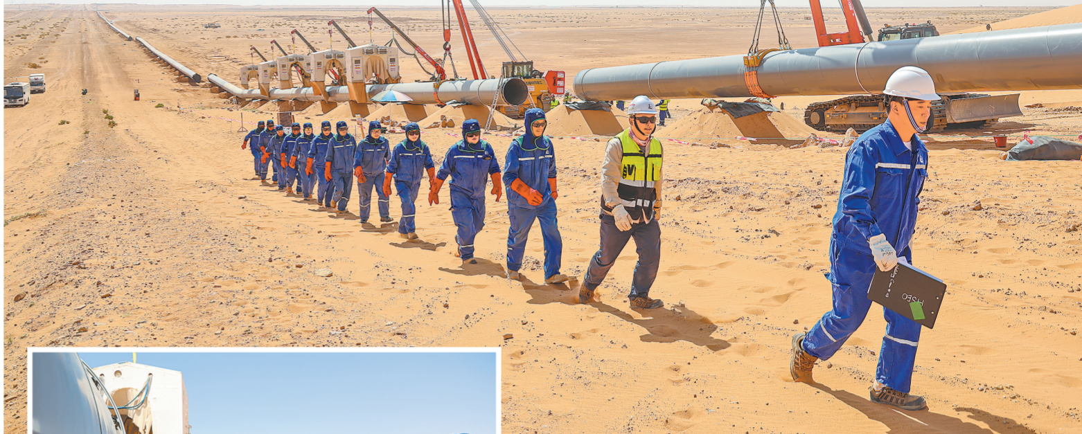
▲图为施工人员进行现场设备检查。