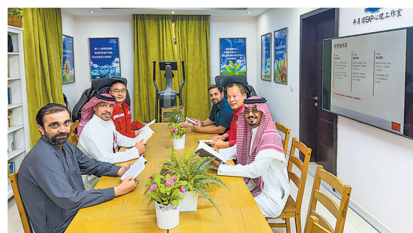
胜利石油工程沙特项目部在世界读书日组织读书分享活动,中外员工共读经典名著,分享阅读感悟,共促中沙文化交流、思想交融。