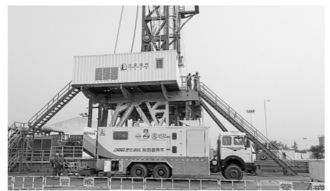
国家油气钻采设备质检中心首创移动检测车,将实验室开展的检测项目带到作业现场,解决无法集中检测的难题。

通过对数千起失效案例的系统分析,中心定位关键失效诱因:65%源于由王螺纹根部等结构应力集中区域的冲蚀—疲劳耦合损伤,