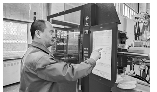
国家石化有机原料合成树脂质检中心技术人员进行注塑试样制备。

研究。通过分析熔融物料的流动曲线,他们识别了不同注塑机及模具在注射过程中的差异,明确了试样测试结果波动的关键原因,为提升树脂材料性能测试结果的一致性、夯实行业检测技术基础提供了支撑。