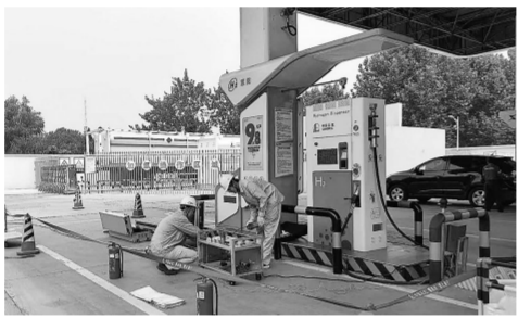
国家石油产品质量中心抽样人员在加氢站进行氢气样品现场采集工作。

资质与能力到位后,标准制定紧随其后。中心系统研究设计了PEMFC车用氢气全项杂质检测方法,形成具有自主知识产权的氢气品质检测及绿色安全实验室建设成套技术,获