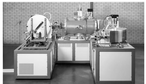
国家基本有机原料质检中心建设的小型加速器质谱仪。

在石油化工材料领域,该设备可通过精确测定材料中的碳-14含量,从而测定材料生物基含量,实现生物基含量的鉴别与评级。在