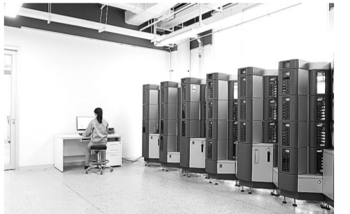
国家高分子材料与制品质检中心检测人员在管材分级控制室设置长期静液压试验参数。

目前,中心已建成国内规模最大、唯一具备分级评价能力的塑料管道行业第三方实验室,压力测试站点超3000个,每年可完成近20个新牌号分级评价工作。自2002年为燕山石化出具国