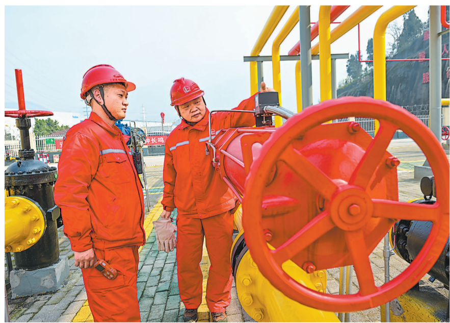
涪陵页岩气公司采气工认真检查采气设备，严抓作业安全。