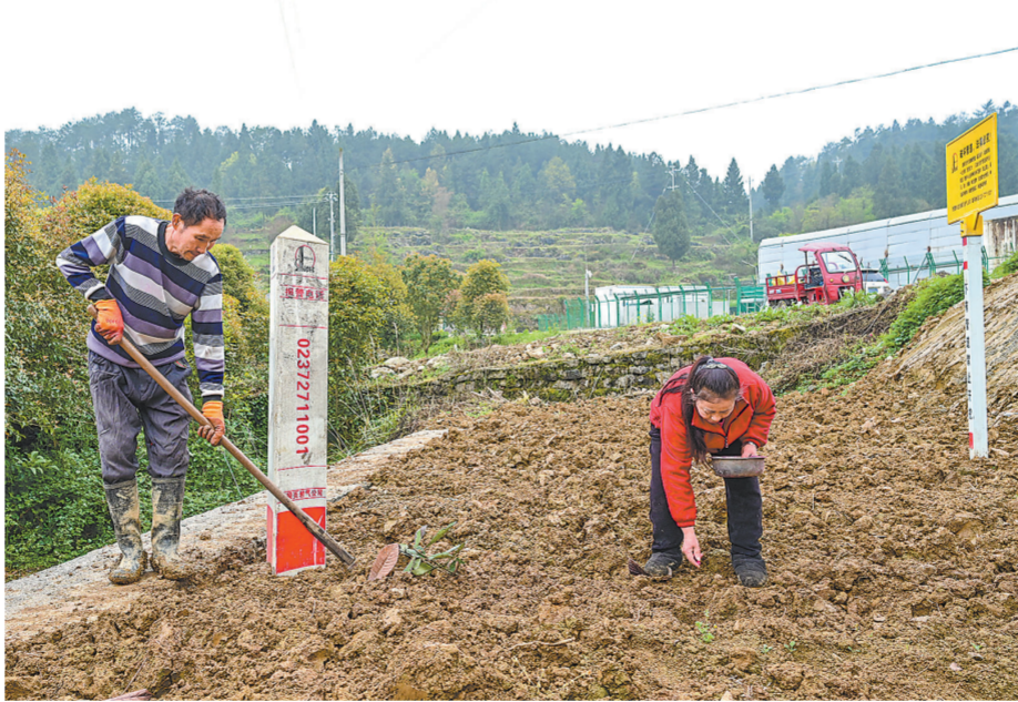
村民抢抓农时，在复垦土地上播种。