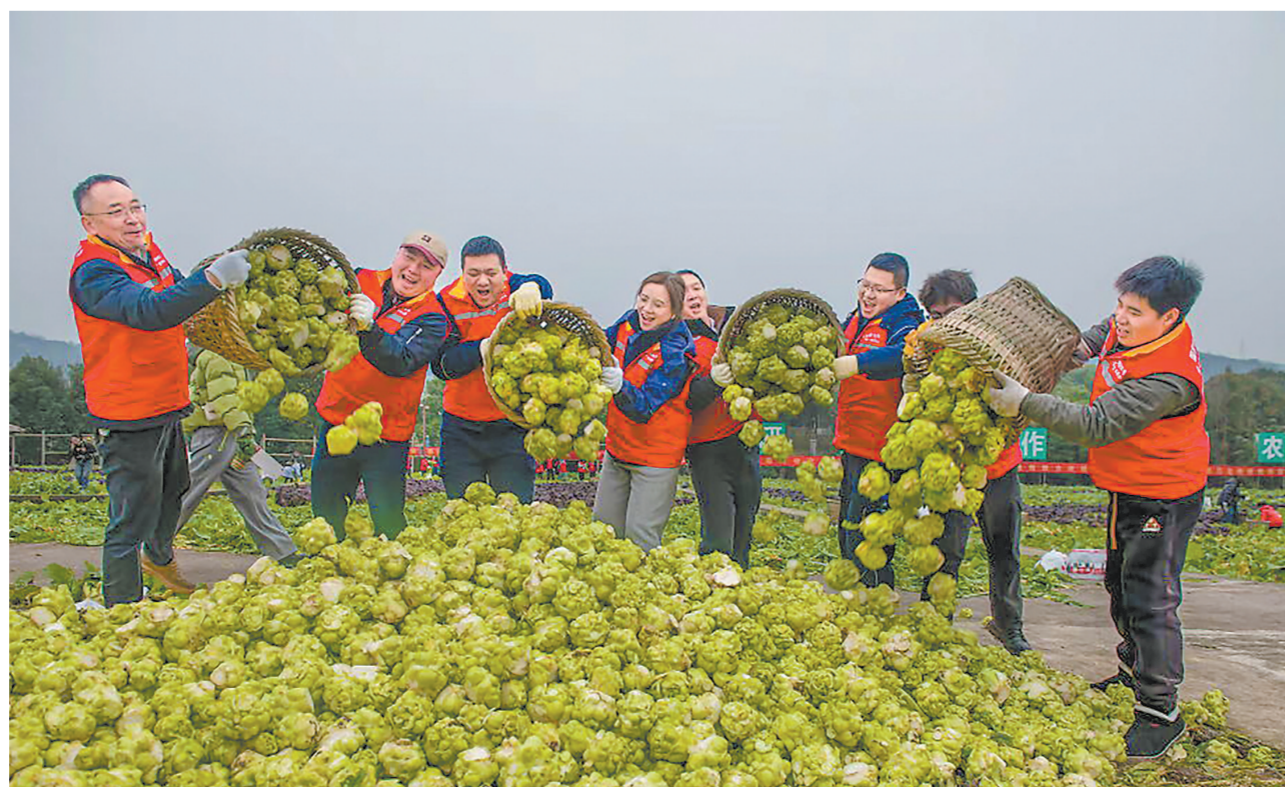
村民种植的青菜头喜获丰收，涪陵页岩气公司组织志愿者助农砍收。