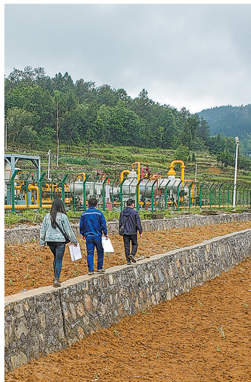
复垦复绿专项工作小组成员现场验收复垦土地。