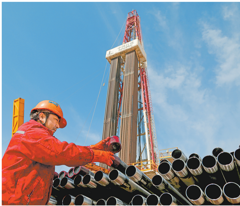
▲西北油田全力打好能源保障攻坚战,塔河油田、顺北油气田和碎屑岩油藏开发“三线并进”,稳产上产势头良好,截至目前,油气日产量较年初实现稳定增长。图为3月24日塔河TH10444CH井完井作业现场。刘红新摄 王福全文