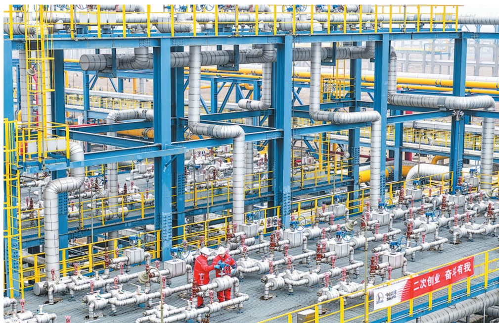
今年以来,天然气分公司聚焦拓市扩销,持续完善管道气营销体系,创新推出“无忧”系列产品,协同开展LNG直供业务,推动产业链持续延伸,全力扩大市场规模、提升经营效益。图为天津LNG接收站员工在工艺区巡检。