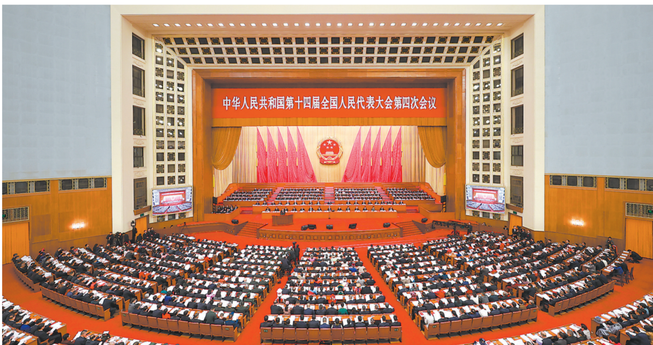
3月5日上午，第十四届全国人民代表大会第四次会议在北京人民大会堂开幕。

李强在报告中指出，根据《中共中央关于制定国民经济和社会发展第十五个五年规划的建议》，国务院编制了《中华人民共和国国民经济和社会发展第十五个五年规划纲要(草案)》，提交大会审查。贯彻落实党中央《建议》明确的主要目标，《纲要(草案)》细化提出20项主要指标；分领域阐述了“十五五”发展的重大战略任务，突出体现四个方面：一是突出推动高质量发展，二是突出做强国内大循环，三是突出推进全体