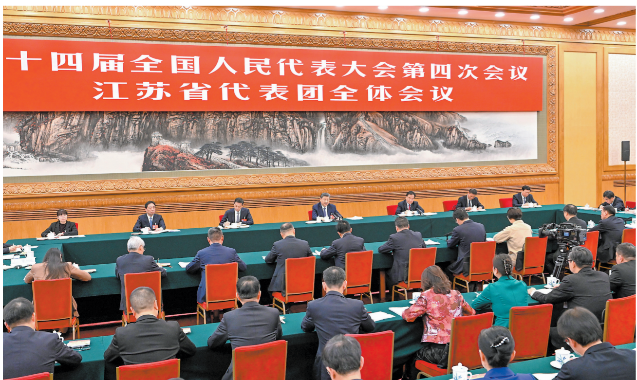
3月5日下午，中共中央总书记、国家主席、中央军委主席习近平参加他所在的十四届全国人大四次会议江苏代表团审议。

新华社北京3月5日电 中共中央总书记、国家主席、中央军委主席习近平5日下午在参加他所在的十四届全国人大四次会议江苏代表团审议时强调，完成“十五五”经济社会发展目标任务，需要应对更加复杂的环境、解决更多深层次矛盾。江苏等经济大省处在改革开放前沿，要在研究新情况、解决新问题上下功夫、出经验。