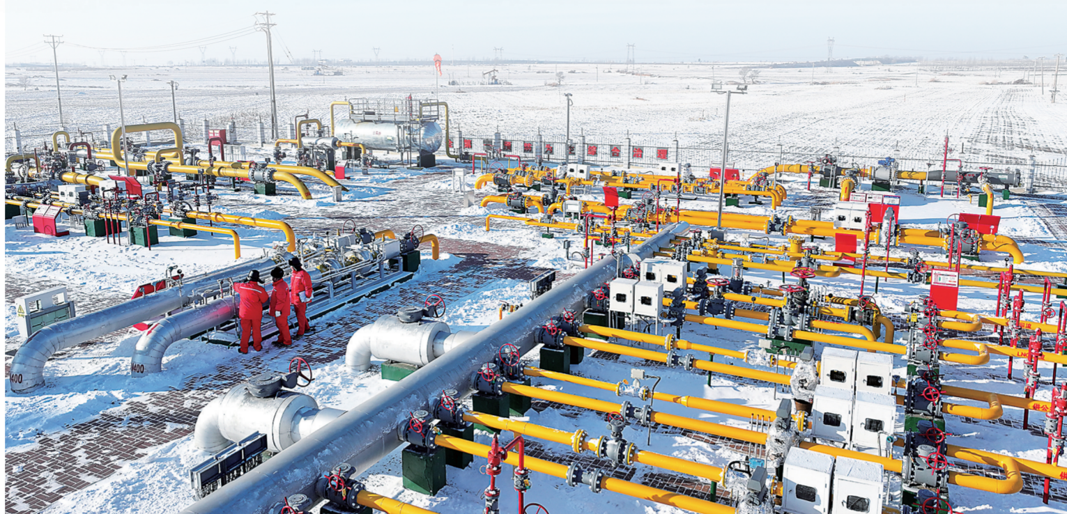
集气站员工顶着严寒,仔细检查站内设备,全力保障低温天气下油井安全生产。