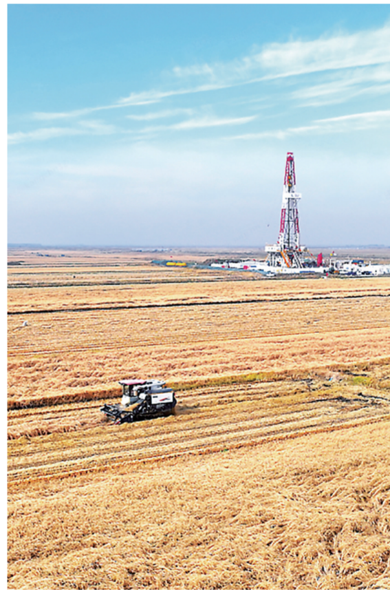
新胜3井钻井现场,金色稻田与钻井平台和谐相映。