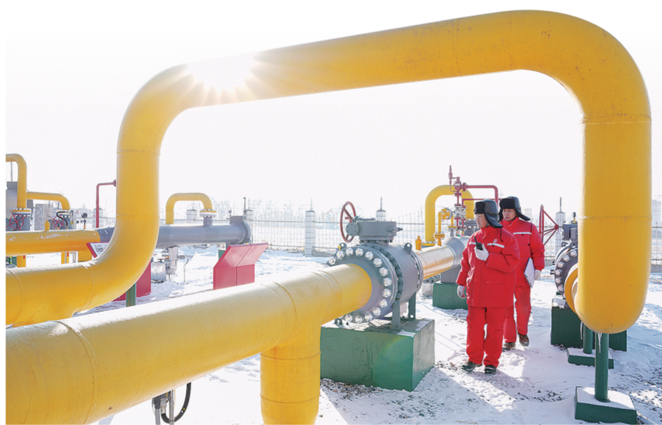
操作人员现场巡查输气流程及压力表。