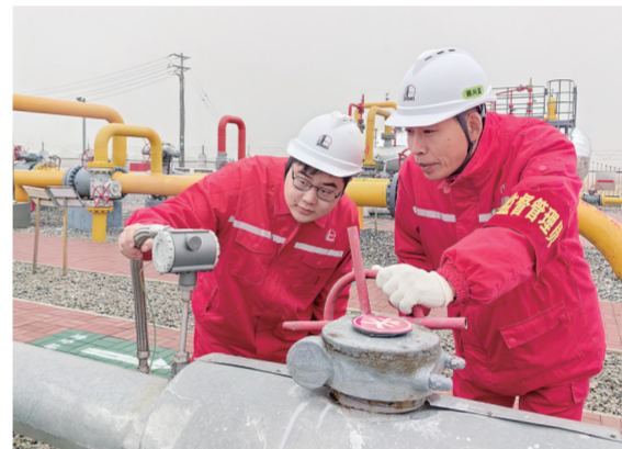
员工在现场检查计量仪表。