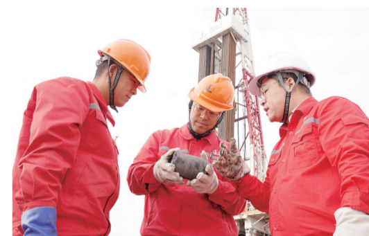
钻井工程技术人员在作业现场分析岩芯组分。

“十四五”以来,东北油气分公司在攻坚克难中勇毅前行,用实干践行使命,以实绩书写了东北油气田高质量发展的奋进华章。5年来,东北油气分公司交出了一份亮眼答卷:连续5年完成油气产量、储量双重目标任务;原油产量增长130%、天然气产量增长21%,企业盈利连创历史新高;率先建成中国石化首个碳中和储气库,首次跻身集团公司党建考核A档,新增矿权面积位居集团公司前列,基层改革模式成为集团公司典型案例,多项发展成果实现历史性突破。