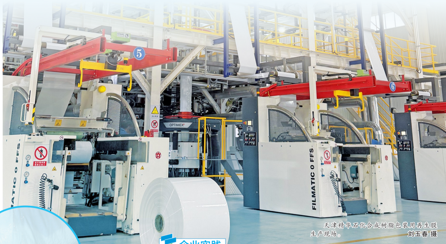
天津清华石化合成树脂包装用再生膜生产现场。