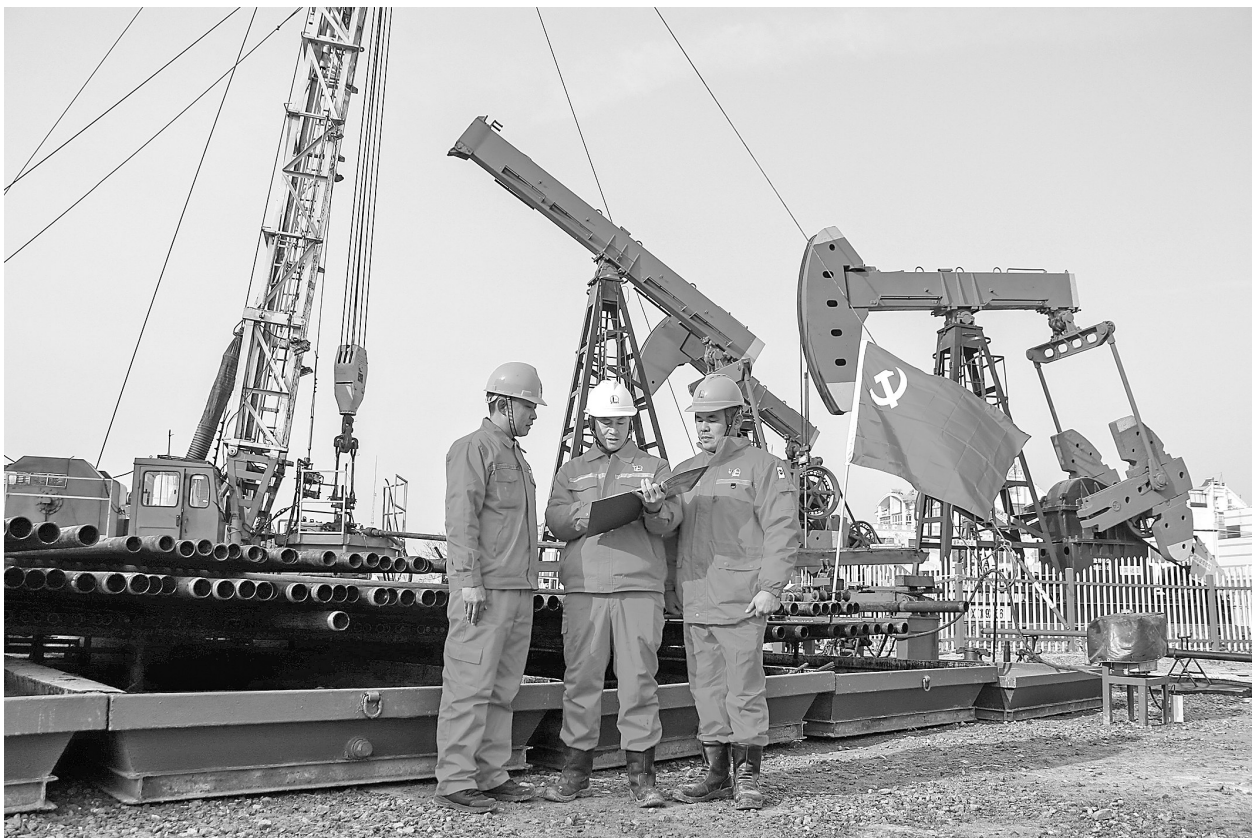
党员带班劳动确保竞赛活动高效运行

近日,胜利油田油气井下作业中心开展百日攻坚竞赛,该中心东辛作业区党员干部和一线员工同吃同劳动,解决生产运行中存在的问题,推动生产管理水平和工作效率提升。竞赛活动开展以来,党员干部带班劳动600多人次,协调解决实际问