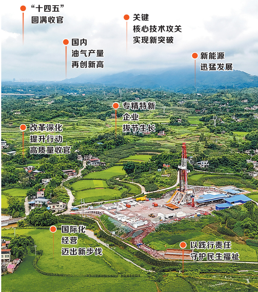
图为西南油气分公司2025年探明的超千亿立方米大型深层整装页岩气田——永川页岩气田永页37-1HF井。

5年成就充分证明,中国石化的实力与活力、稳健与韧性,全体石化人的众志成城、团结奋斗,正是发展信心最坚实的支撑。站在承前启后的历史交汇点上,我们更加坚信,只要沿着习近平总书记指引的方向,遵循科学理念、保持战略定力、发扬斗争精神、把握历史