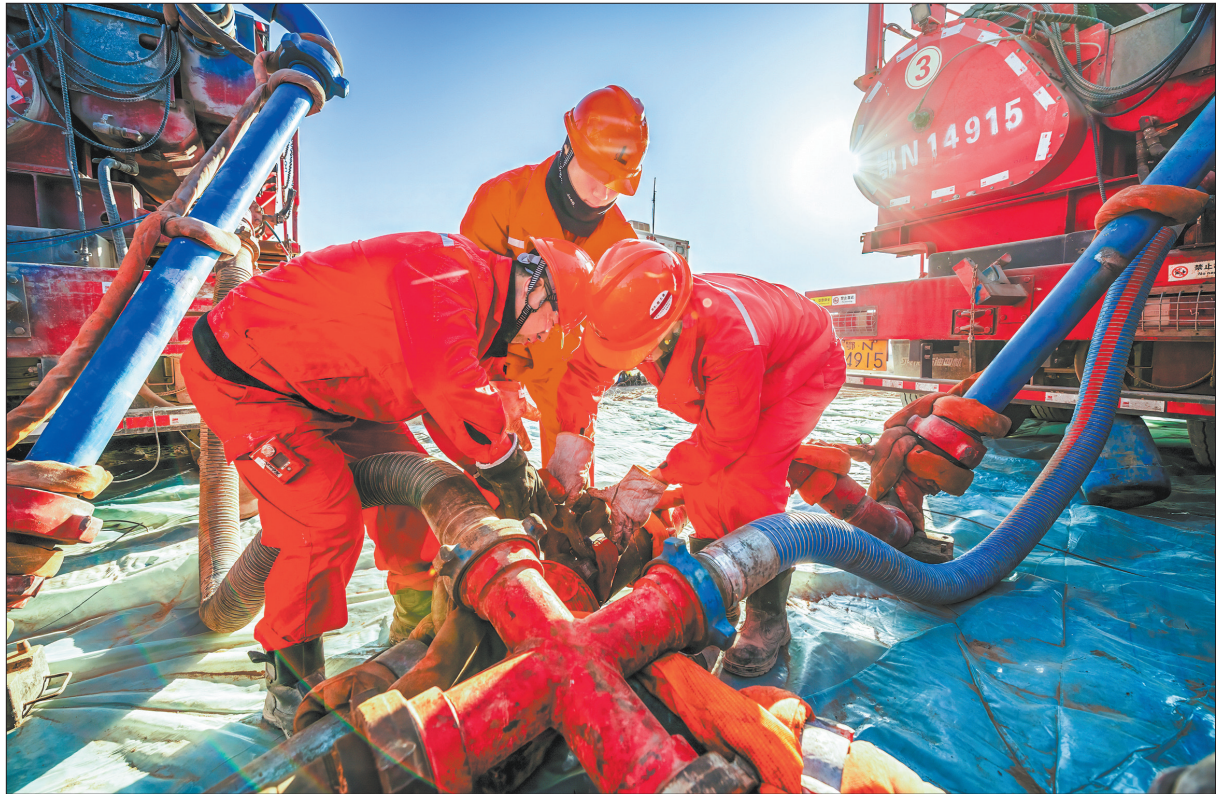
▲今年以来,西北油田通过实施酸压、堵水、大修等措施提高老井资源挖潜能力,推动老区未动用储量实现规模效益动用,累计完成措施挖潜作业500井次,增油46.3万吨,较计划增产1.3万吨。图为近日塔河油田TH10280CH井井场,施工人员在准备酸压作业。

聚焦终端销售比重提升,升级直分销配送等增值服务。“一户一策”定制供油方案,延伸油品检测、应急保供等增值服务,客户黏性显著增强,客户交易活跃度持续攀升。积极开展油非互促,以“一客多单”模式带动直分销渠道易捷服务,综合创效显著。