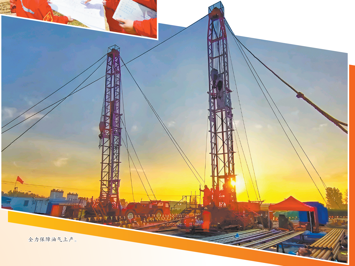
全力保障油气上产。

本版文字由 杨静丽 晁旭 郭艺博 孙磊 程杨利 向美强 孙立辉 提供