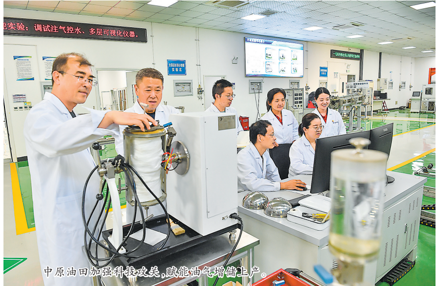
中原油田加强科研攻关,赋能油气增储上产。

将绿色低碳理念深植发展基因,从勘探开发到清洁生产,从经营管理到矿山建设,绿色已成为中原油田最亮丽的底色。油田已连续7年获得中国石化“绿色企业”称号,普光分公司连续9年获评四川省“环保诚信企业”,内蒙古工区连续6年荣膺自治区“绿色矿山”,内光的荣誉,见证着中原油田在生态文明建设中的执着追求。