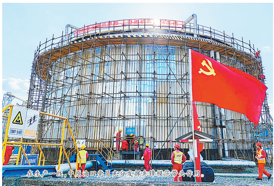
在绿氢产业链中,中原油田积极融入氢能产业链建设。