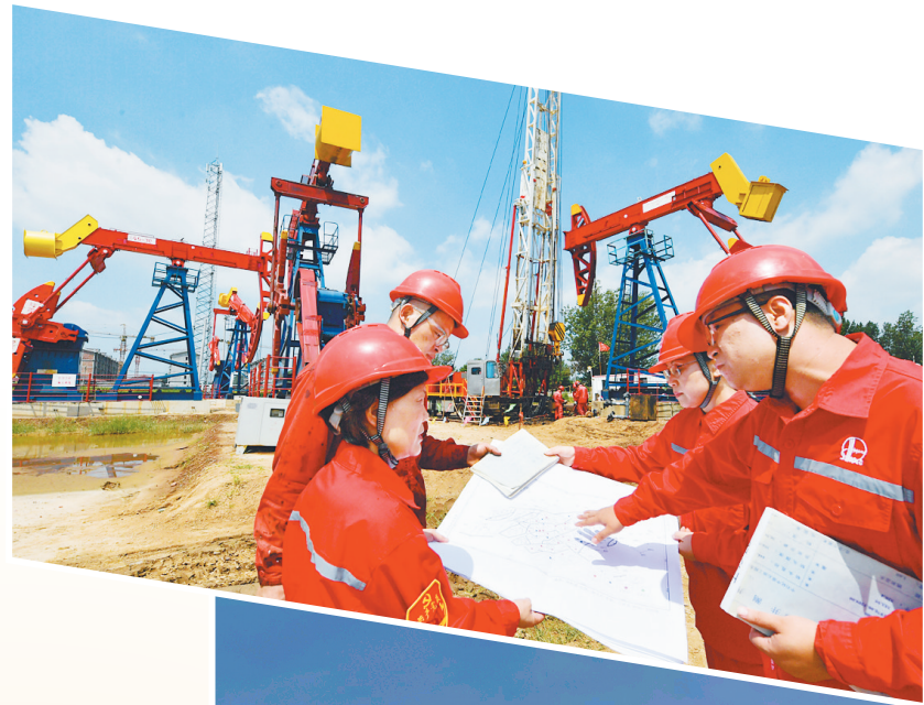
科研院所与生产单位联合开展科研攻关。

面对国家油气探矿权市场化改革深入推进的新形势,中原油田将矿权拓展作为重点工程,按照“立足现有、辐射周边、扩展类型”的思路,2024年成功竞得南华北盆地豫西2区块、太康西2区块、周口区块和洛宁1区块等4个新区块,总面积为2675.13平方千米,为油田可持续发展开拓了广阔的战略新空间。