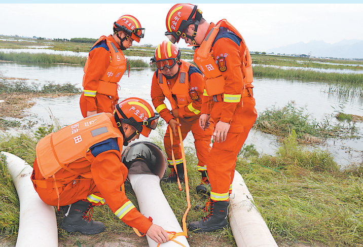
中原油田应急救援中心驰援内蒙古哈素海水库进行排涝抢险。