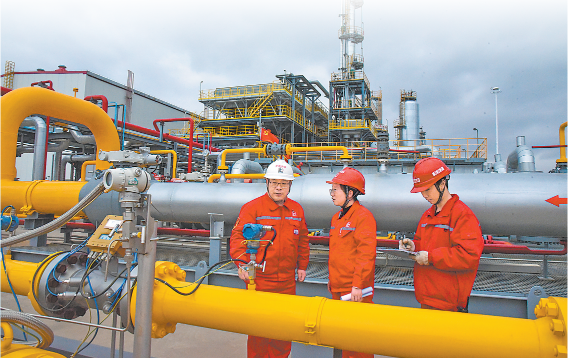
中原油田榆林区域神木项目部员工对延长油田的设备进行巡检,确保其安全平稳运行。

光技术好不算好,整体素质好才算真的好。为打造一支纪律严明、作风过硬的外部市场队伍,中原油田从工作、内务、健康等5个维度入手,为外部队伍量身定制了20条规定,并将其融入交接班、设备巡检、操作作业等日常工作,提振外部市场队伍的精气神。据统计,