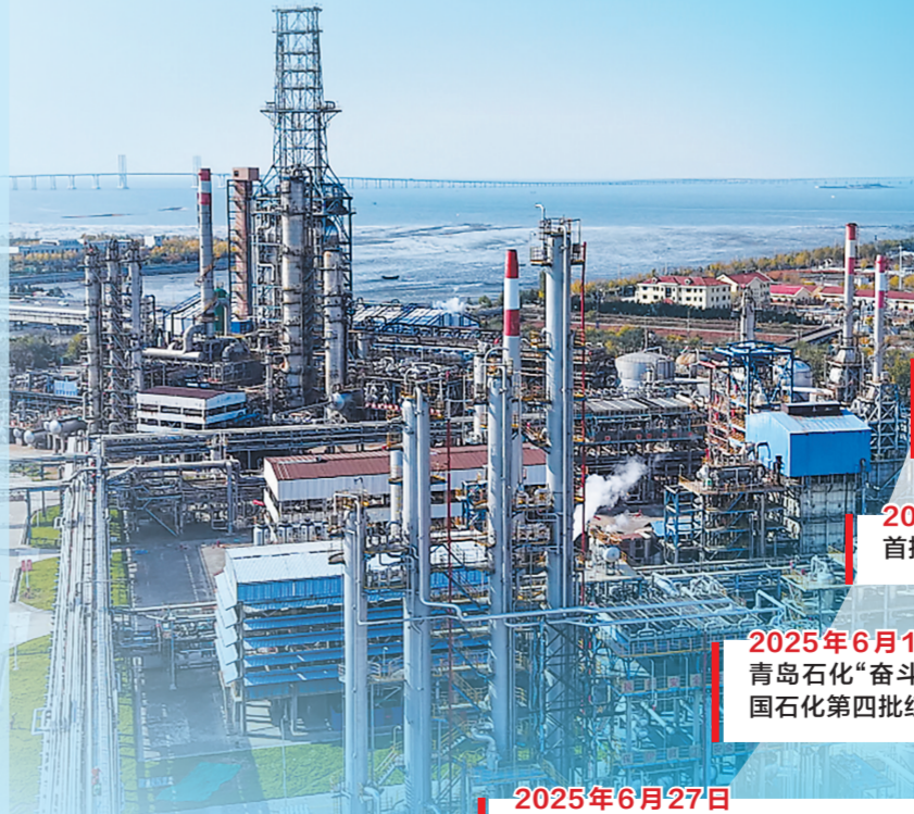
青岛石化厂区装置。