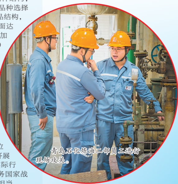
青岛石化炼油三部员工进行现场攻关。