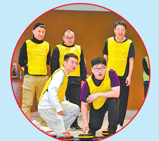
青岛石化举办冰壶健身主题活动。

赋能技术创新,秉持从“攻坚克难”到“有解思维”的理念。 青岛石化以创新思维拓展发展空间,赋能提质增效,跟踪落实全年攻关创效方案,聚焦生产技术难题与创效瓶颈实现精准突破:强化关键设备全生命周期管理,实现重要装置长周期稳定运行;动态优化生产运行流程,加大攻关力度,增产增销高附加值产品,保障高端碳材料稳定产出;高度重视科技创新,实施MPP(多产丙烯和低硫船用燃料油的催化裂化技术)项目,实现船燃低成本稳量产,为企业发展注入强劲动能。