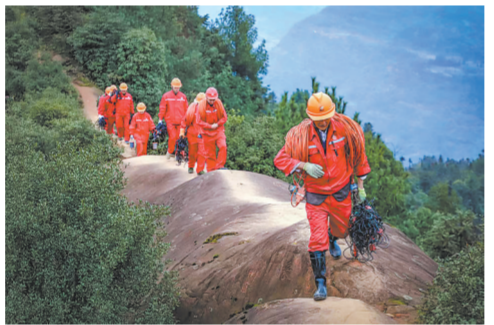
地球物理公司南方分公司员工开展物探作业。