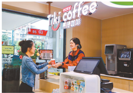
客户在四川石油黄荆沟加能站购买易捷咖啡。