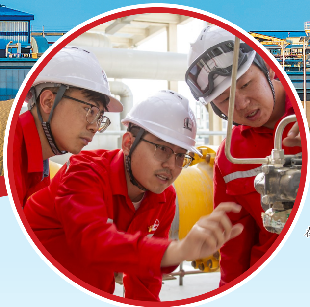
“三义线”党员工作室成员 在现场进行联合攻关。

“能源的饭碗必须端在自己手里。”习近平总书记的殷切嘱托饱含厚望,指引方向。塔克拉玛干沙漠,黄不见天的漫漫沙海中,直穿万米的钻塔林立下,黑金喷薄的抽油机间,一个个身影忙碌穿梭。西北油田的员工们用智慧挥洒汗水,在这片土地上生动践行保障国家能源安全这份沉甸甸的责任。 五载栉风沐雨,五载接续奋斗,“十四五”以来,西北油田认真贯彻落实习近平总书记能源安全新战略以及视察胜利油田、九江石化重要指示精神,按照集团公司统一部署安排,大力实施七年行动计划,全力推动油气增储上产、关键技术攻关、深化改革管理、强化安全环保、加强党的建设,加快推进油田高质量发展,为中国石化建设世界一流企业、保障国家能源安全作出积极贡献。 这是西北油田创造发展新高度的5年,见证了西北石油人打造千万吨级现代化大油气田建设的历史时刻。在天山南北,他们干劲十足、奋力拼搏,在波澜壮阔的能源报国画卷中,书写着属于西北油田的绚丽篇章。