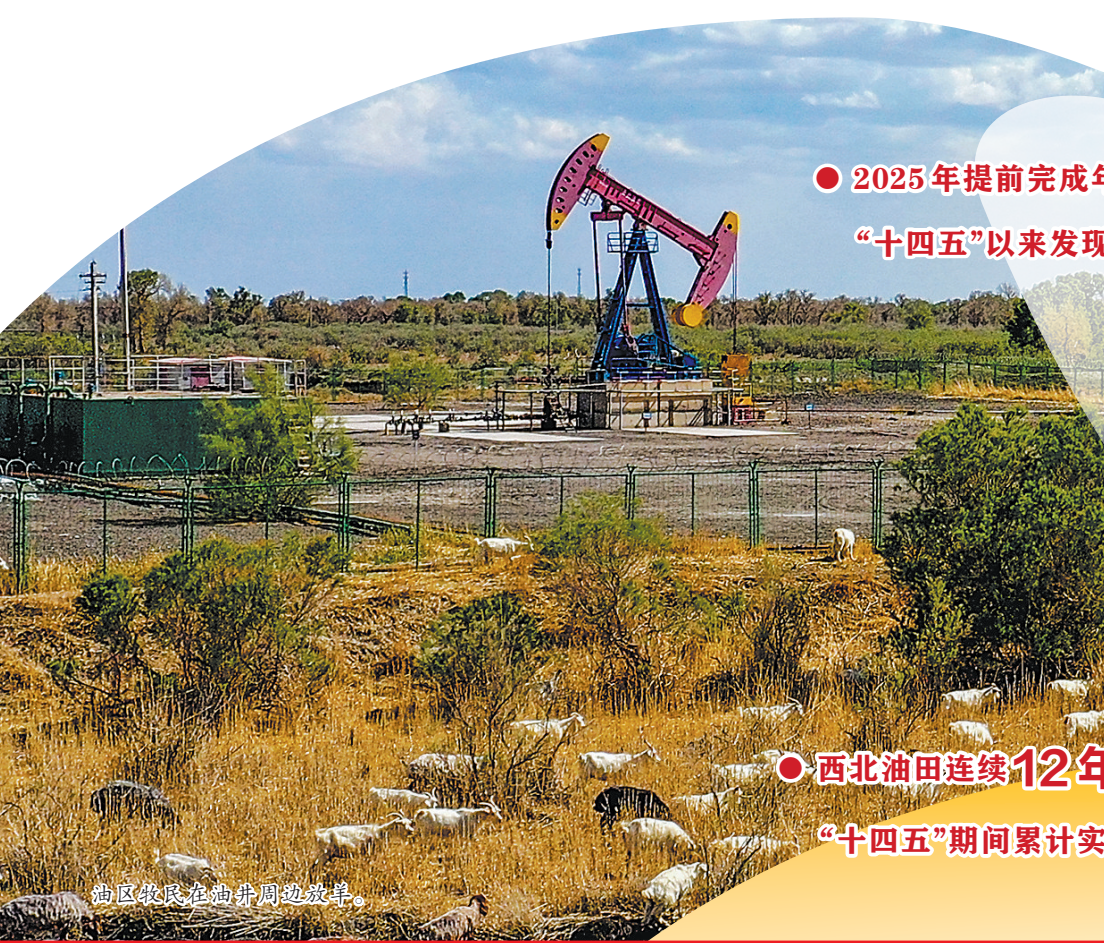
顺北地区全油田中部景象