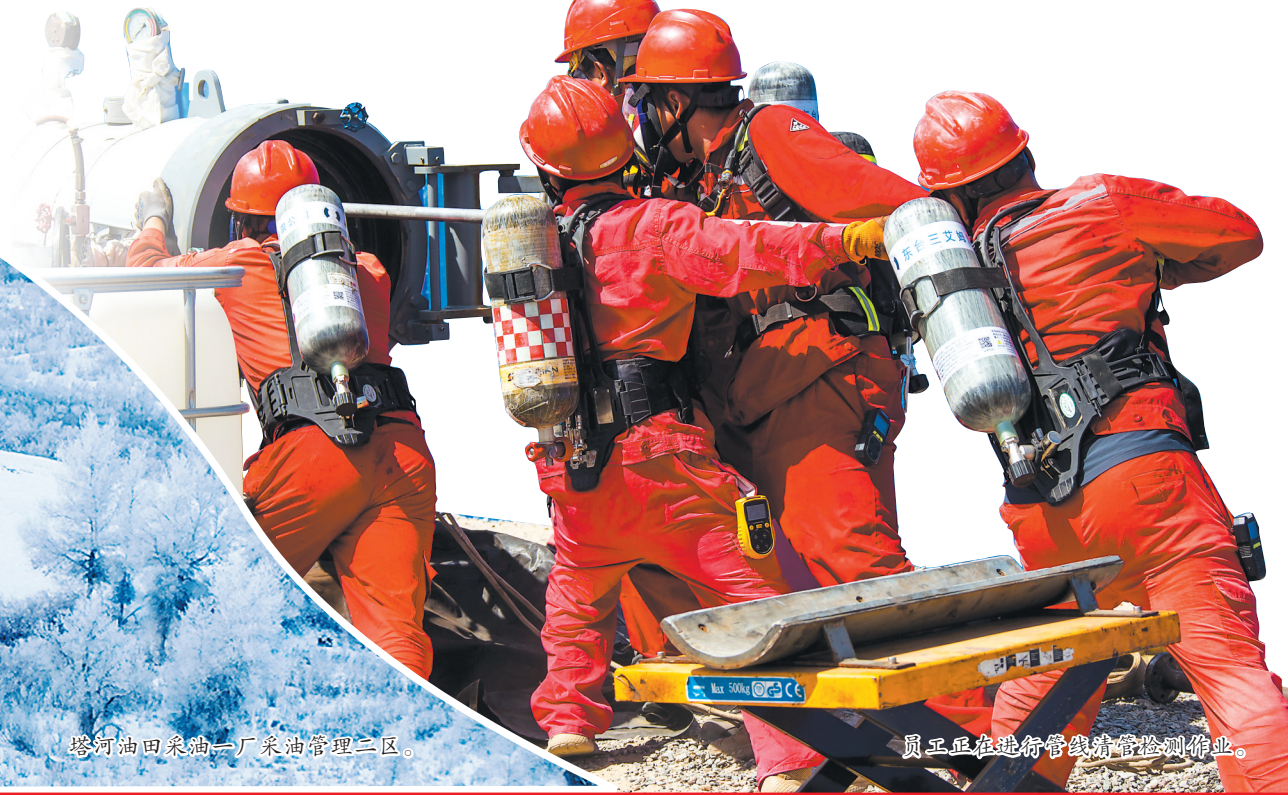
顺北油田采油二厂采油管理区二区