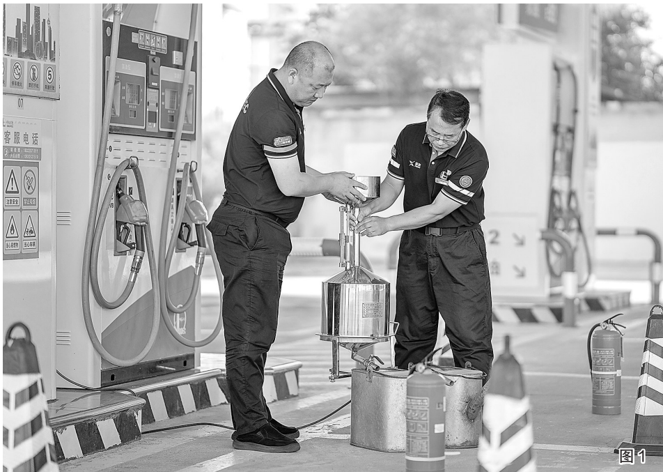
图1:全国质量月期间,天津津北石油紧扣“加强质量支撑 共建质量强国”主题,扎实开展多项质量提升行动。公司组织对所属加能站的加油机开展全面自检工作,严格把控油品计量精度,确保油品品质充足、计量准确,切实维护消费者权益。图为9月19日,津北石油五里铺加能站员工对加油机进行自检。