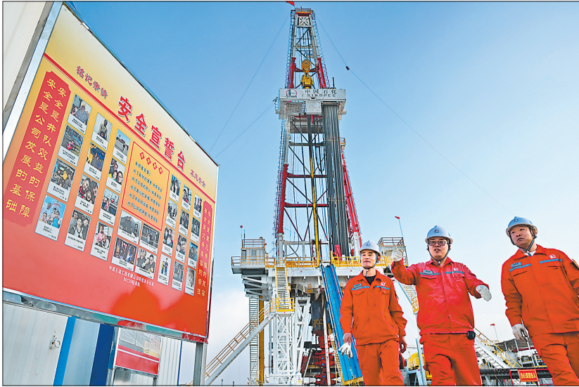
中原油田工程塔里木分公司持续加强安全文化建设,开展宣传教育活动,将父母的嘱托、妻子的期盼制成“全家福”,用亲情浇筑起安全生产的铜墙铁壁。图为 9 月 20 日塔里木分公司 90129 钻井队员工观看施工井场附近的“全家福”安全文化展板。通讯员 林信胜 张永宏 文

市场,拓展共建“一带一路”国家和地区市场,持续拓宽苯胶、橡胶助剂销售渠道。加快转型升级步伐,高质量推进南京本地电子级硫酸、千吨级石化装备制造基地技术改造升级及福建异地苯胶—橡胶助剂产业链项目。培育壮大新兴产业,发挥 CCUS 技术优势,推进 CCUS、催化剂等领域科研成果孵化落地。拓展电子级化学品产业,形成自有技术,培育技术人才,建设科技创新孵化基地。