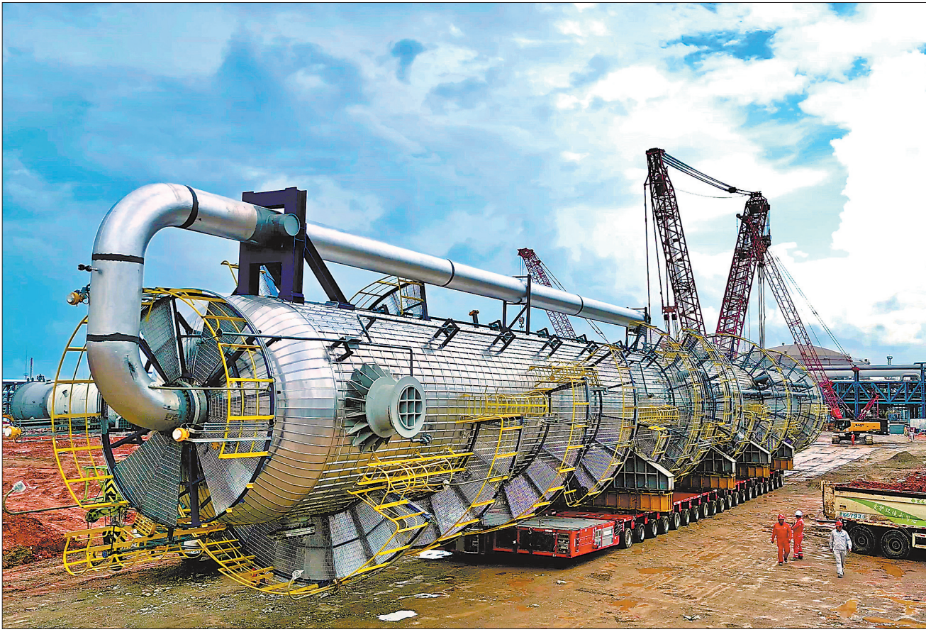
中国石化首次完成大型塔器模块化高位运输

9月7日,茂名石化升级改造项目100万吨/年裂解装置的碱洗塔模块化短距离高位运输顺利完成,标志着中国石化在大型塔器设备模块化高位运输领域实现零的突破。此次运输设备总重量539吨,全程260米,运输高度2.6米,属于大型塔器设备的高位运输。茂名石化组织起运公司、工程建设公司、十建公司等参建单位,从设备受力分析、地基处理、运输路径规划等方面,开展多轮技术论证与方案推演,圆满完成运输任务。图为碱洗塔模块化高位运输现场。 张安可 杨川 李娜 温锦陶文