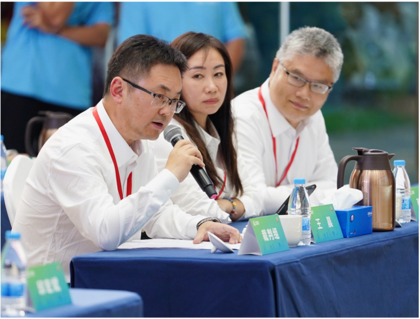
决赛现场,执裁裁判进行点评打分。