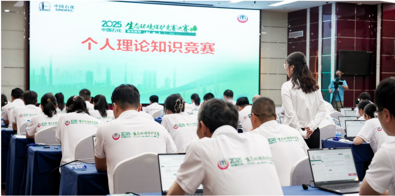
个人理论知识竞赛考场内,选手们全身心投入答题。