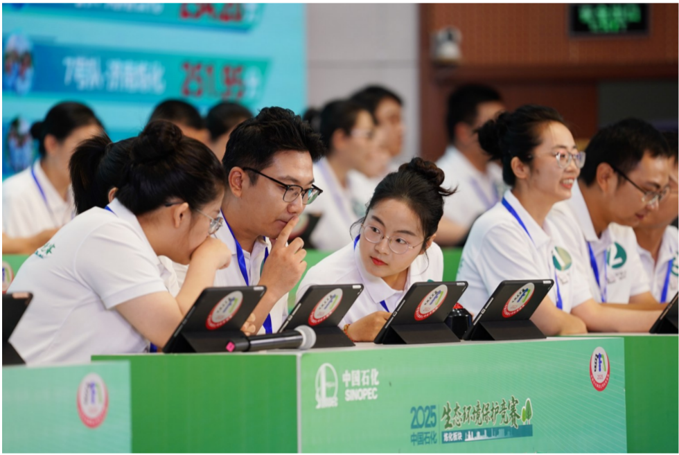
团体决赛现场,上海石化选手分析题目,调整答题策略。