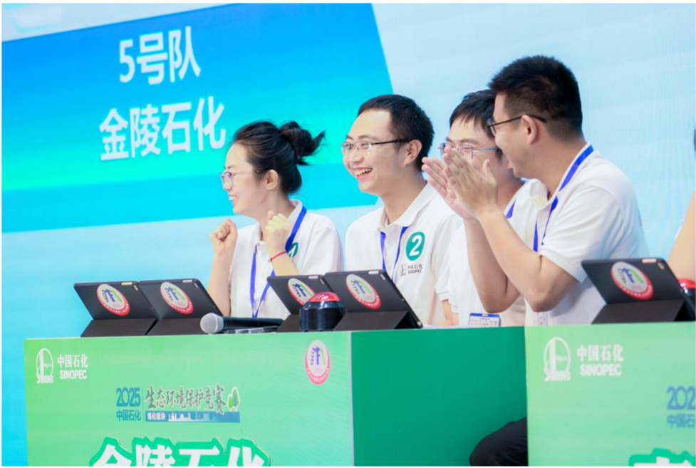
团体决赛现场,金陵石化选手答题得分后欢欣雀跃。