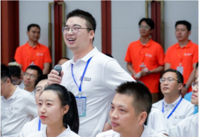
决赛现场,观摩团参与答题互动。