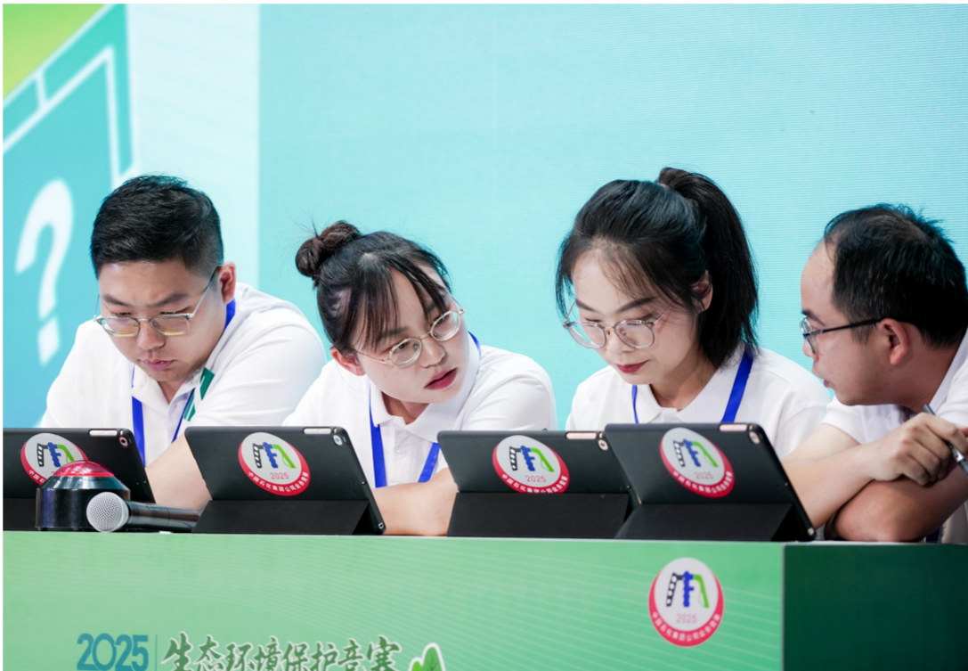
团体决赛现场,扬子石化选手讨论分析,准备答题。

此次竞赛的成功举办,集中展现了炼化企业环保人员扎实的理论功底、精湛的业务技能与良好的精神风貌,有效激发了全员“学环保、钻业务、强技能”的热情,为集团公司持续深化绿色低碳发展、筑牢生态环保防线奠定了坚实的人才基础。