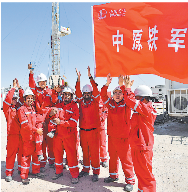
▲收到甲方颁发的奖杯,井队员工一起庆贺。