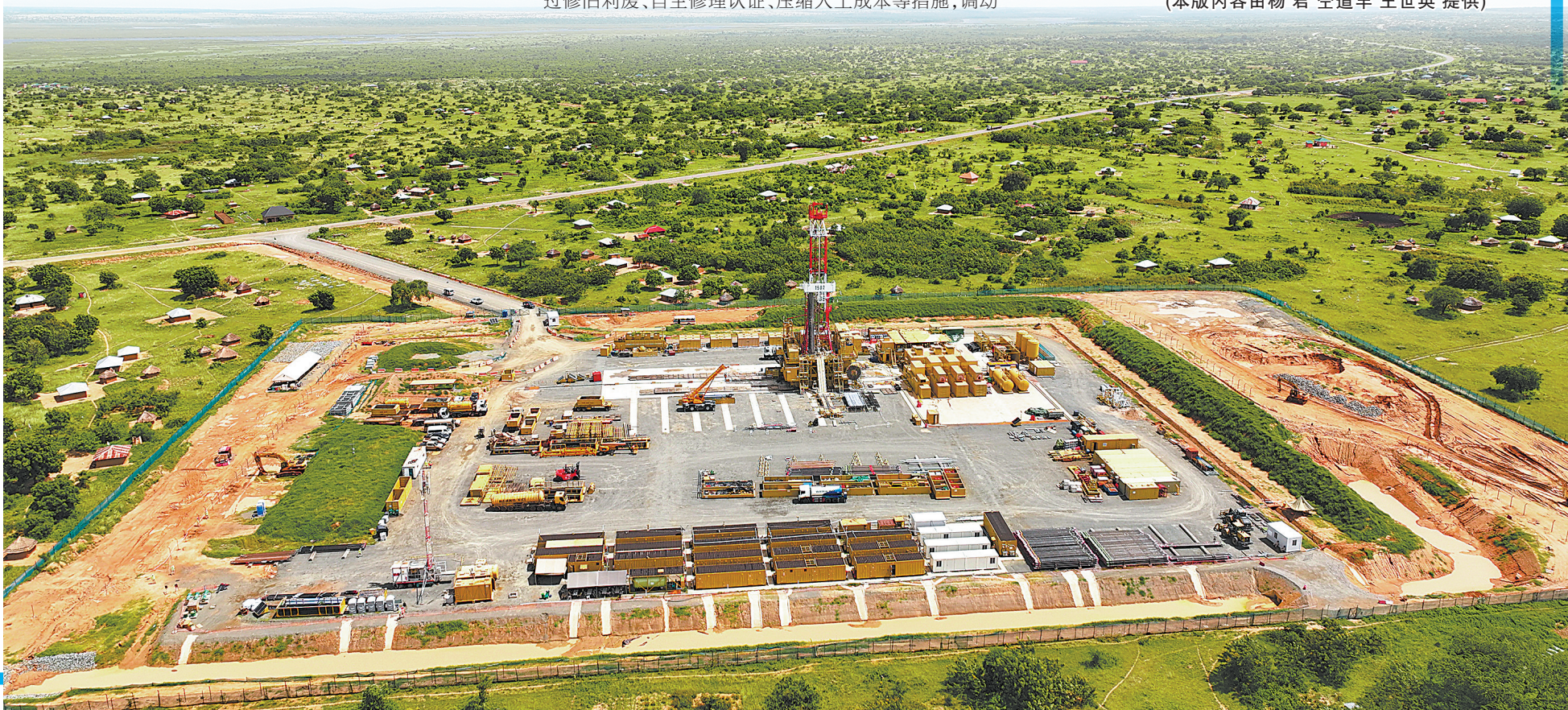
►乌干达项目1502钻井队作业现场。