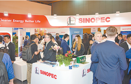
图为燃料油公司在 2024 年新加坡国际船展会上展示船舶加注领域成果。