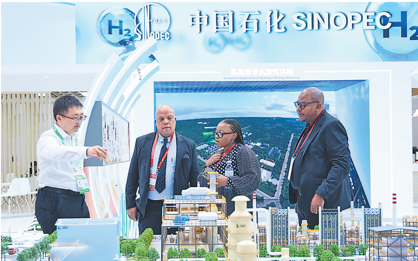
图为中国石化亮相第三届链博会现场,展示高质量发展成果与前沿技术、产品,受到参会者广泛好评。