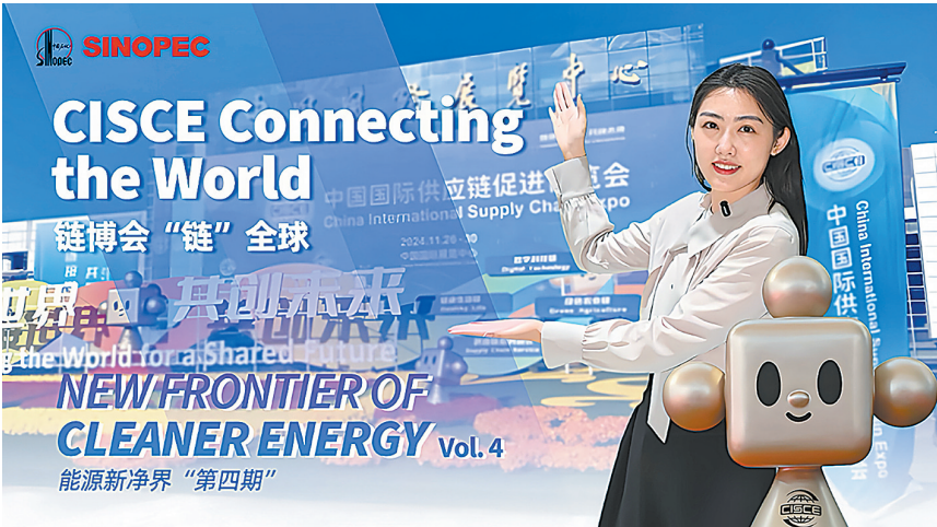
▲第二届链博会期间,石化报记者实地探访中国石化展区,并通过海外社交媒体平台展示中国石化的高科技产品与应用场景。