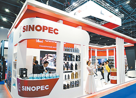
图为中国石化润滑油产品亮相哈萨克斯坦阿斯塔纳国际汽配展。