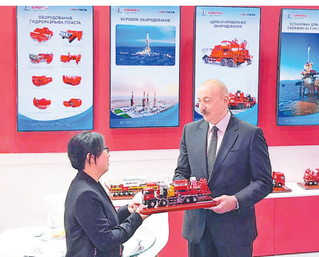
图为石化机械公司参加第三十届环里海国际石油天然气展览,阿塞拜疆总统莅临展台参观交流。