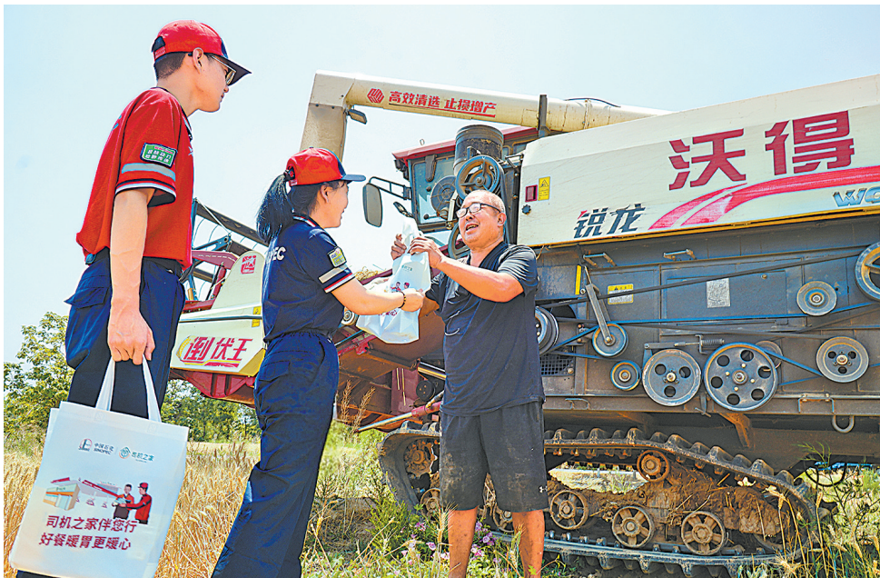
近日,山西运城石油支农小分队走进临猗县蔡村,为农机手送清凉物资。 秦晓耕 文

便民服务、暖心服务,助力“三夏”。湖北石油与湖北省农业事业发展中心签署战略合作协议,充分利用1000余个网点优势,统筹调配10万吨惠农柴油,推出一系列便民惠民措施,助力湖北夏粮丰产丰收。6月正是南方水果丰收季,广东石油对农机用油客户实行5%购油优惠,并在多个地市开放易捷销售渠道,协助果农销售水果。化销华北向甘肃石油定点