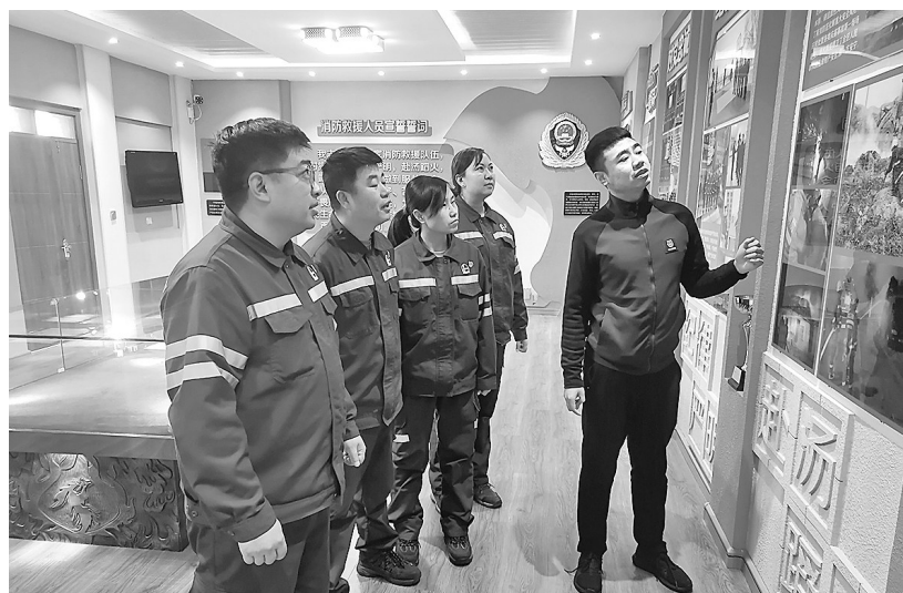
为进一步提高安全管理能力,2024年12月27日,黑龙江齐齐哈尔石油组织油库党员到昂昂溪区消防队参观,学习火灾的预防、火灾发生时的应急处置方法、消防设备的正确使用等知识。图为消防队员向油库党员讲解消防安全知识。