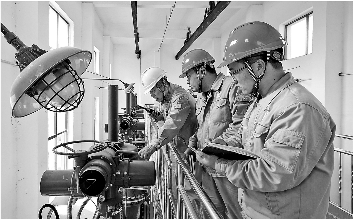
党员承包关键设备 护航装置平稳运行

“优秀党员上讲台”活动将党员的专业知识与党的理论教育紧密结合。活动开展以来,共有39名党员登台讲课。该活动激发了全体党员的学习热情和创新能