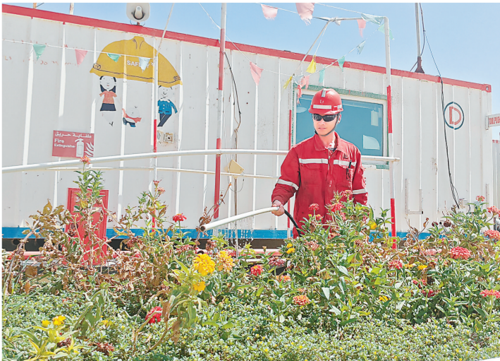
图为项目部员工在为营地花坛浇水。