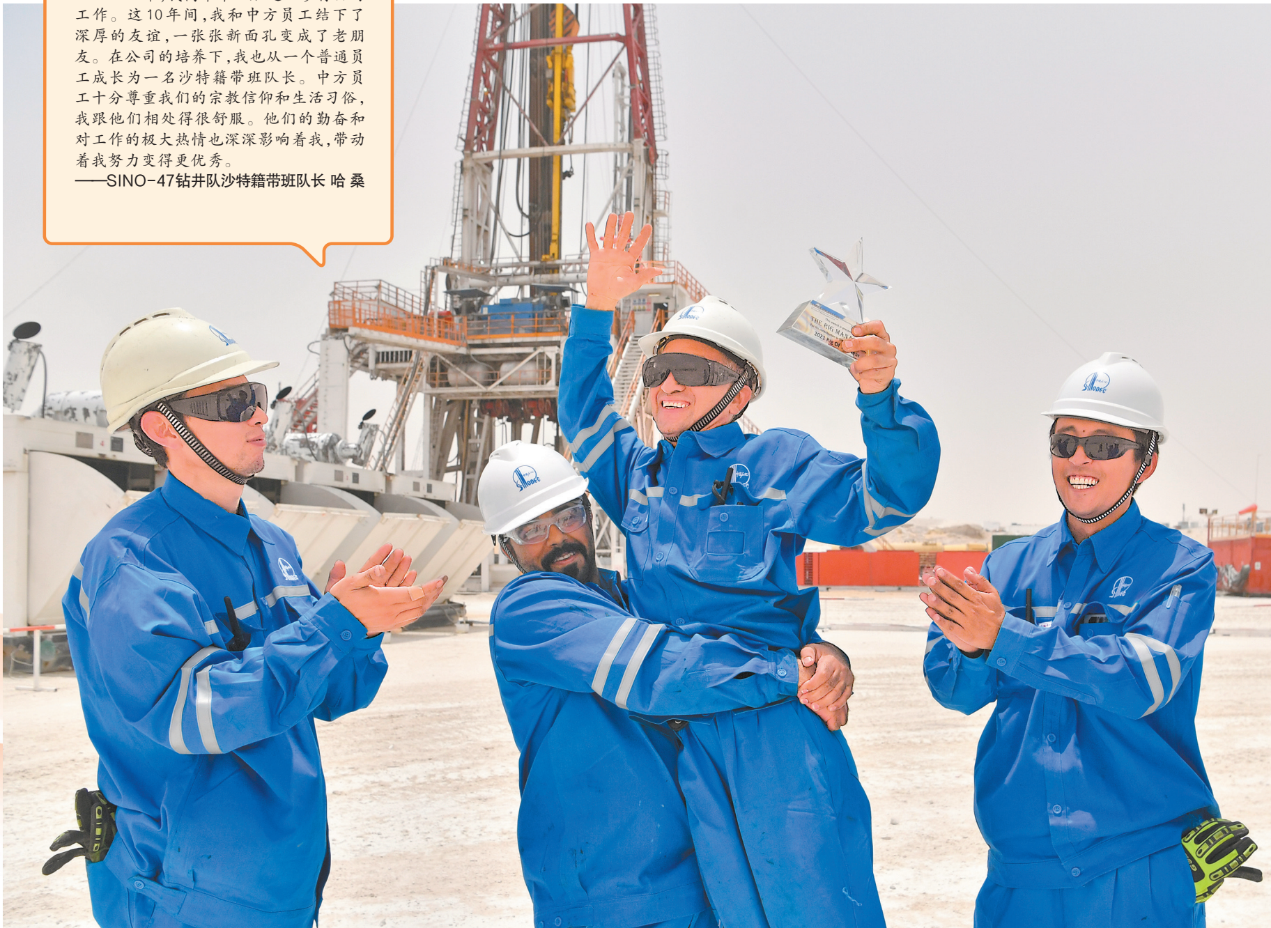
井队获得甲方颁发的奖杯,外籍员工激动地抱起中方员工庆祝“国际合作”取得共赢。