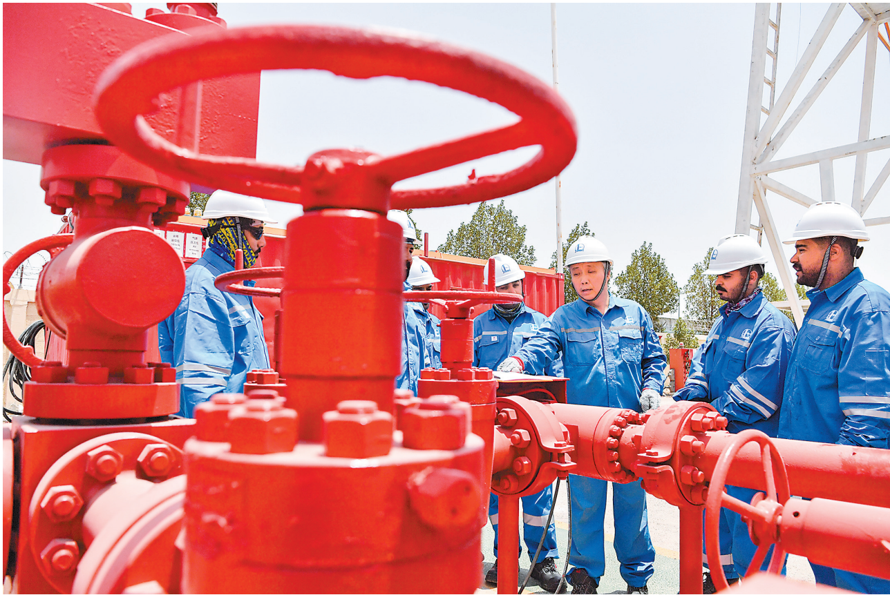
公司组织培训师(右三)为外籍员工讲解技术细节。