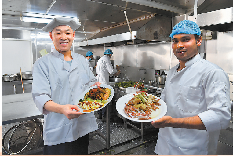
沙特公司定期组织厨师交流厨艺,厨房里弥漫着家的温馨。