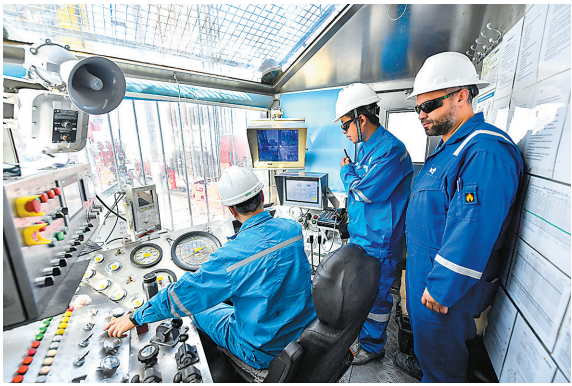
中方员工和外来监督在司钻房查看钻进情况。