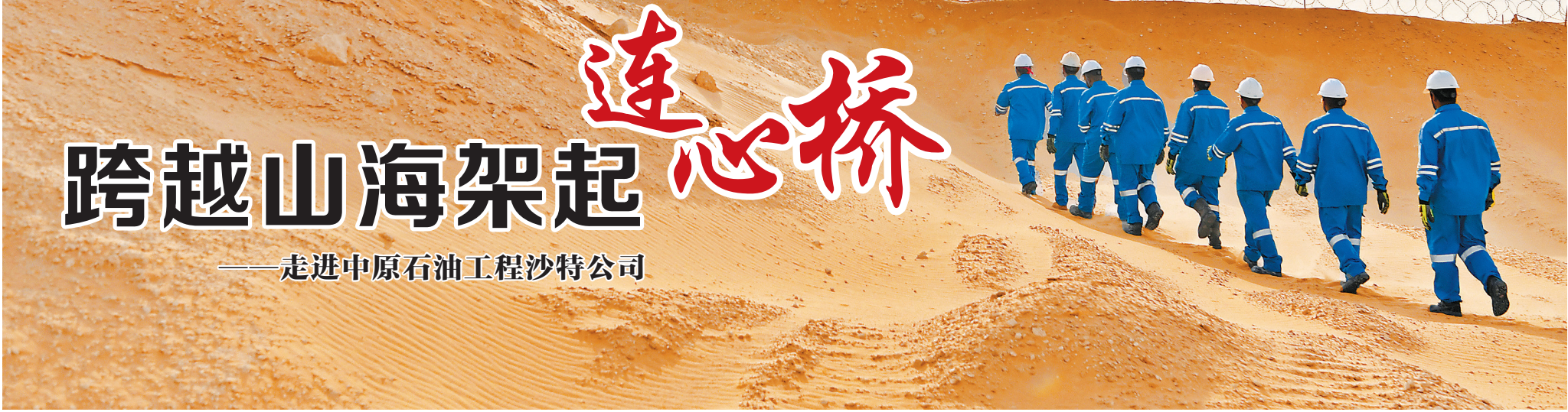
波斯湾畔的茫茫戈壁上,中原石油工程沙特公司中外员工列队走向井场。