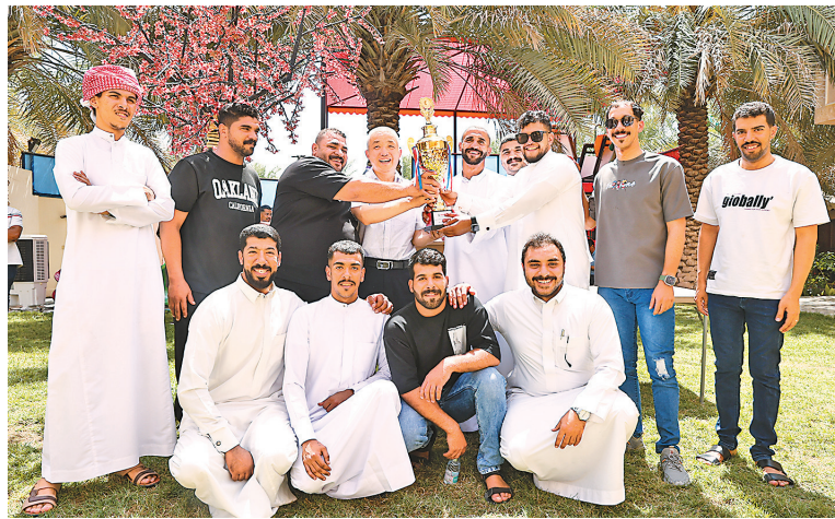
沙特公司每季度选拔优秀雇员,并会组织拔河、足球友谊赛等活动。图为今年二季度优秀雇员参加完拔河比赛后,手捧奖杯庆祝胜利。