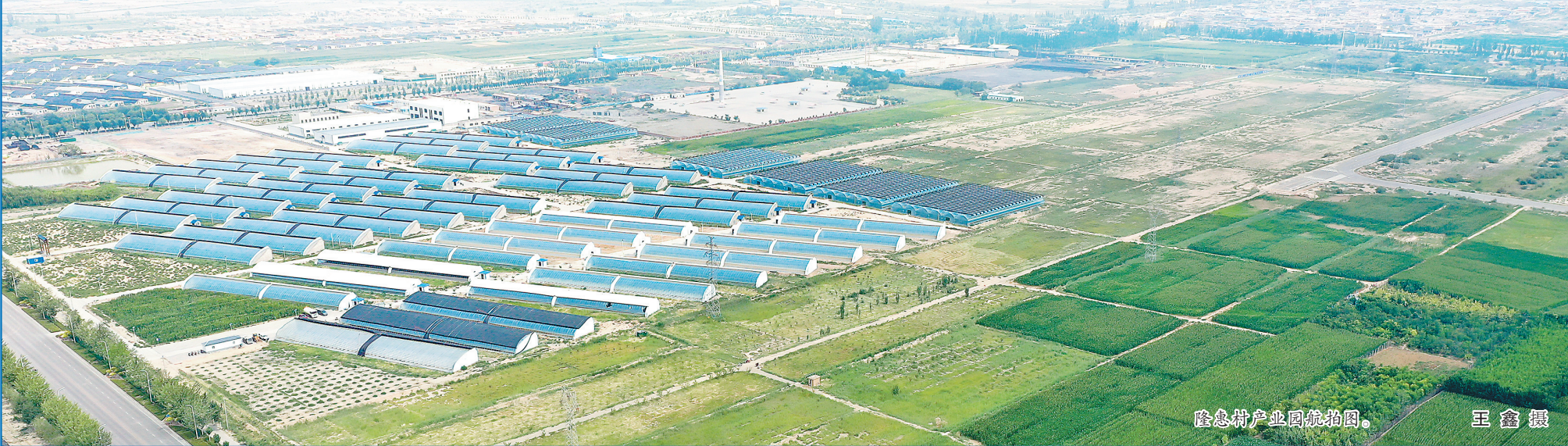
隆惠村产业园航拍图。