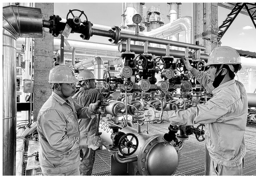
金陵石化水煤浆装置 余热发电机组并网发电

近日,金陵石化水煤浆装置低湿余热发电机组一次开车成功,实现并网发电,进一步提升装置节能降耗、降本增效水平。