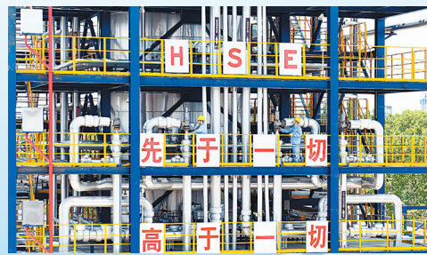
金陵石化员工精心巡检保安。