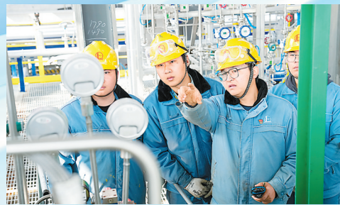
金陵石化新员工现场课堂。