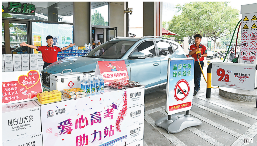
图1:6月5日,北京石油金融街加油站员工为相关车辆热情服务。 于慧 刘芳 媛 文

2024年高考开考之际,中国石化依托遍布全国的加油站网络,在相关主干道和考场附近加油站设置绿色通道,优先为送考车辆加油,在站内开辟家长休息区,免费提供紧急打印、应急文具、防暑药品等服务和物品,引导现场车辆安静通行,全力服务高考。