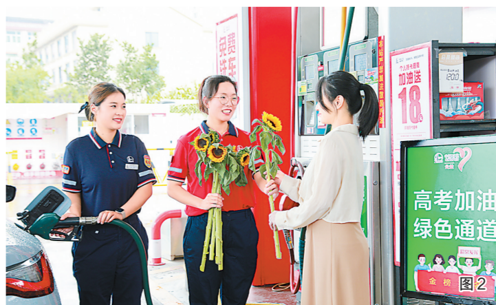
图2:浙江台州石油温岭凤城加油站员工优先为送考车辆加油,并为考生送上向日葵表达美好祝愿。