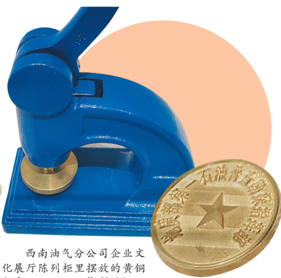
西南油气分公司企业文化展厅陈列柜里摆放的黄铜印章。

1983年,地质部第一石油普查勘探指挥部更名为地质矿产部西南石油地质局。这枚黄铜印章光荣“退役”,但神圣使命和历史责任却并未卸下。西南油