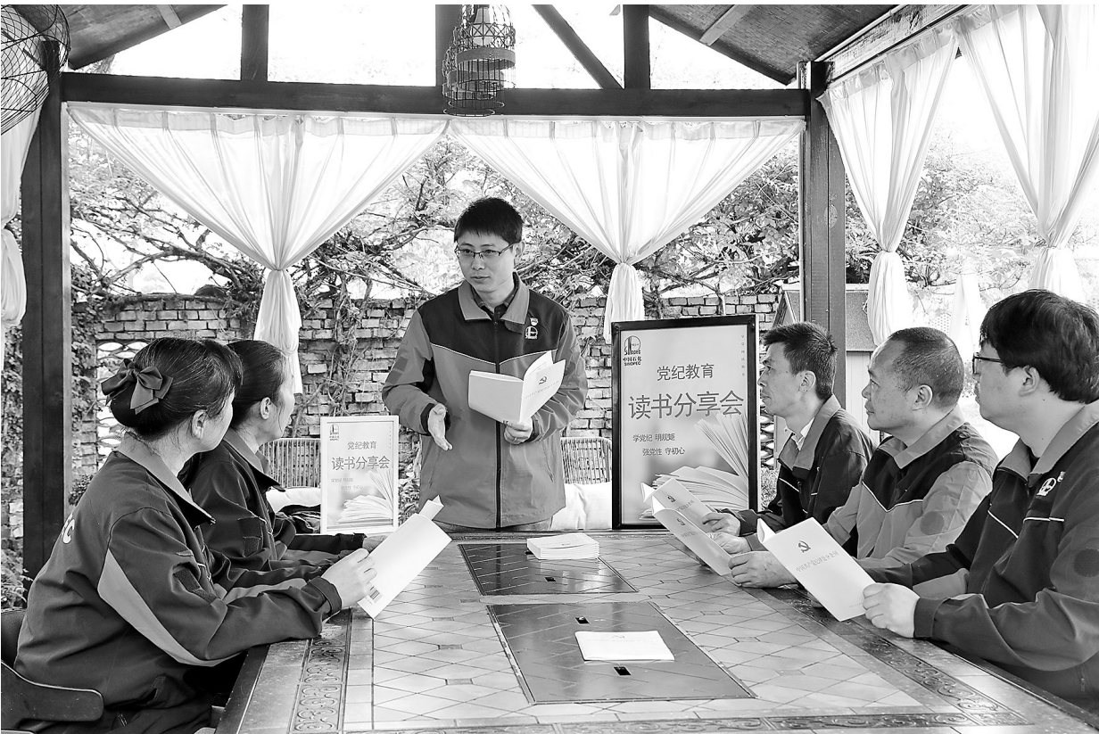
读书分享会推动党纪学习教育走深走实

产管理制度在基层执行严起来、硬起来。二是改进干部作风促发展。聚焦检修维修工程、建设工程、物资采购、产品销售等重点领域,狠抓对承包商管理不严不实不力问题。持续推进服务一线机制落地,严查不作为和乱作为,推动干部改进作风,在纪律规矩上守住红线。三是坚持以人为本抓教育促和谐。将党纪学习教育与关心关爱员工相结合,及时办实事解难事,疏导员工思想情绪,推动形成“人心心舒气顺上岗”局面。