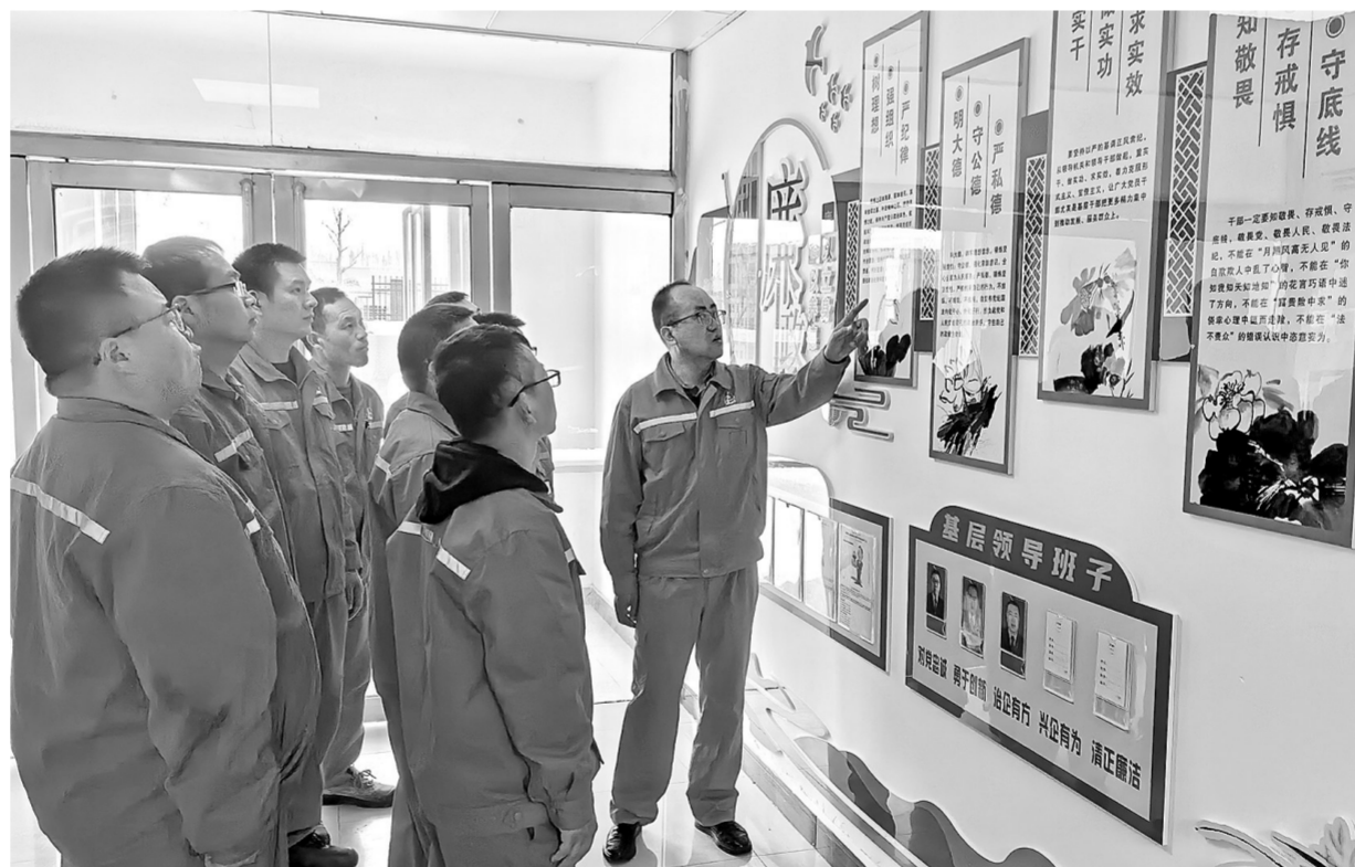
让廉洁教育走实更走心

与此同时,该中心每年邀请专家授课,通过典型案例宣讲,让廉洁教育入脑入心。他们将“中国石化物资采购十条禁令”融入廉洁从业承诺书内容,组织领导干部及重点岗位人员签订《廉洁从业承诺书》,公开接受监督。