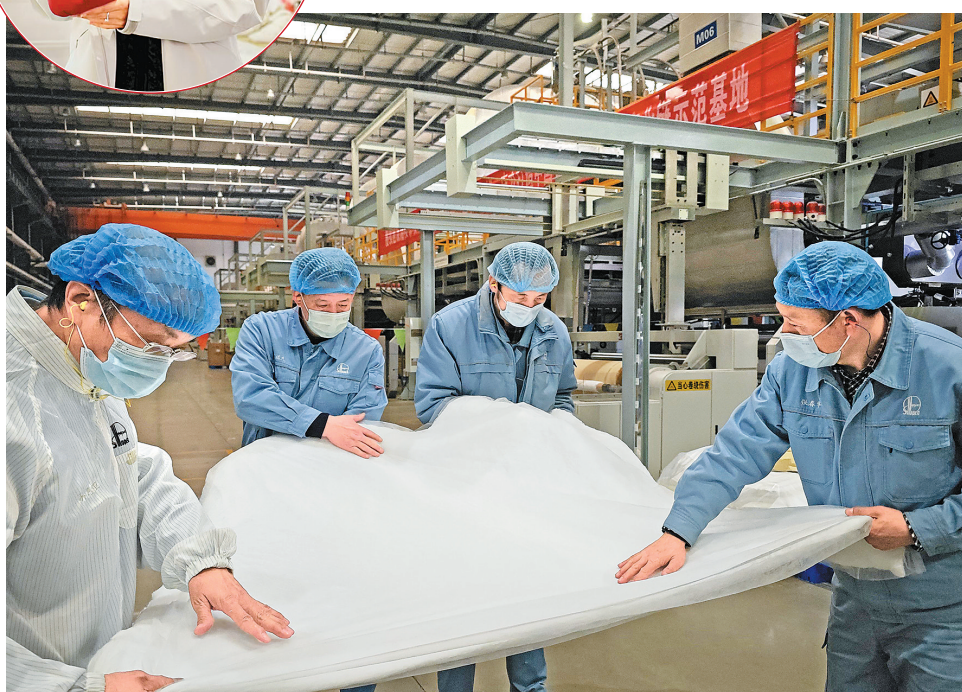
仪征化纤超细纤维保暖絮片质量。