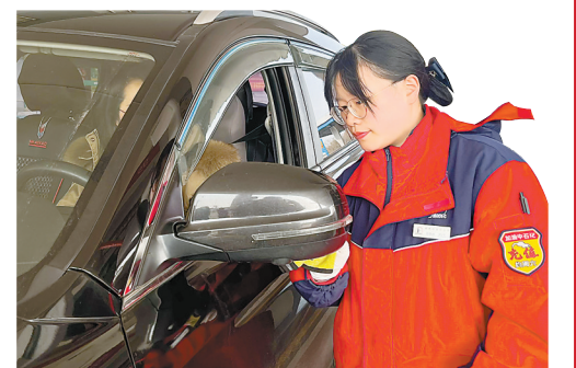
加油站员工为客户擦拭车窗。

很大提升。”德清第七加油站王站长说。秋山加油站作为公司的“标杆站”和“站长站”,担负着加油站管理人员培养和的职责,在销售技巧、业务技能、设备维护、基础管理等方面搭建“师带徒、传帮带”平台。2023年共计培训站长32人次,站长及后备站长取证16人次。站内还经常性开展“岗位练兵”“班组竞赛”等活动,力争做到每名员工都有绝活,人人都朝着大师傅的方向努力奋进,形成“人人有特长、个个有绝活”的好局面。现在,站内8名员工中有6名取得高级工证书,并成立了湖州石油首个万吨站党支部。