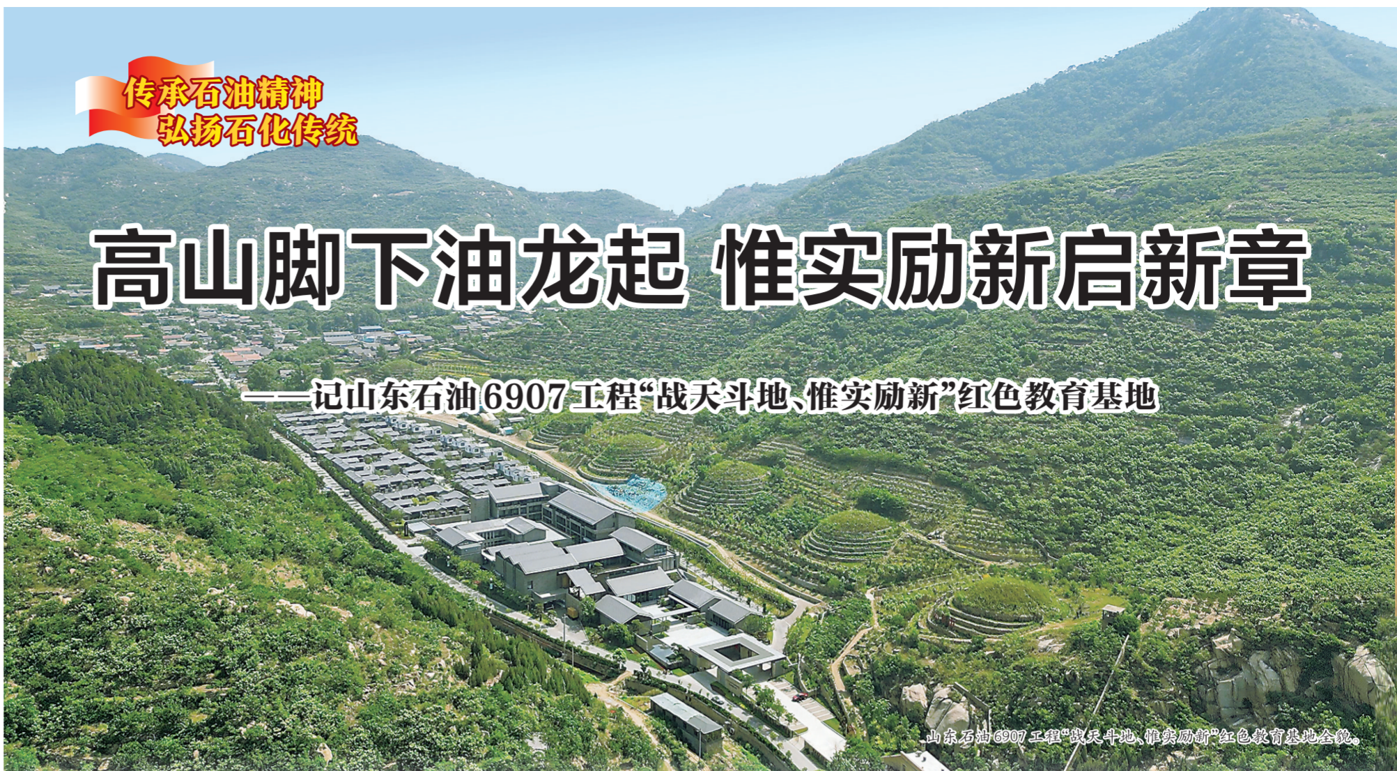
山东石油6907工程“战天斗地、惟实励新”红色教育基地全景。