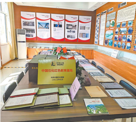
6907工程历史资料展陈区。

紧紧依偎着泰山的臂膀,6907的“乳名”犹在耳畔,利民的使命传承至今,日居月诸,精神永存。连珠般的山丘,虽低于群山,却扎根基石。偌大的胸怀,盛装的不仅是石油,更是先辈们满满的创业激情,其身上蕴含的“战天斗地、惟实励新”精神,激励新时代石油人勇担新使命、奋进新征程。