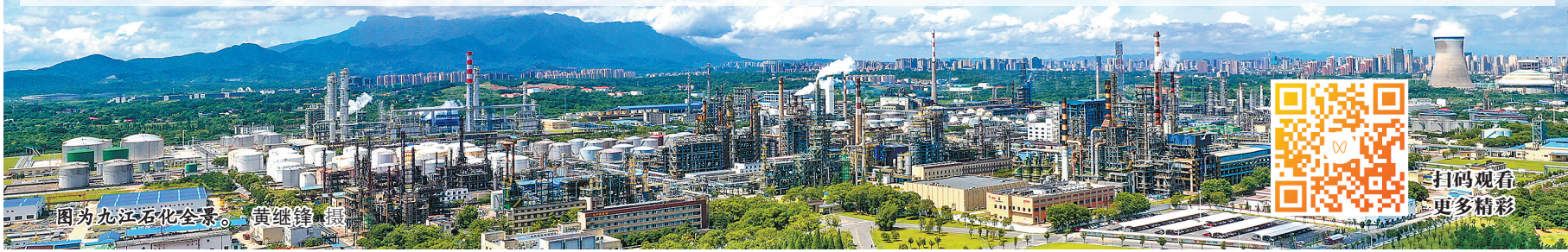
图为九江石化全景。

本期邀请国勘公司郭月良围绕建立现代企业制度、健全决策授权机制等谈改革深化提升行动的思路。(详见2版)