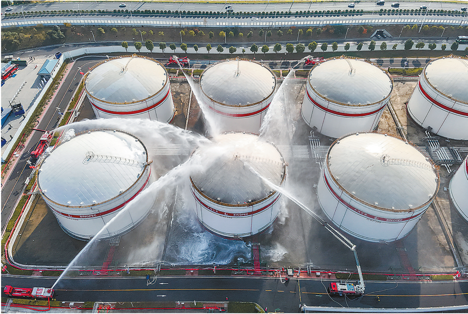
两台拖车炮、两台48米大跨距消防车、1台32米高喷车,从5个方位对演练着火罐G303发起灭火总攻。