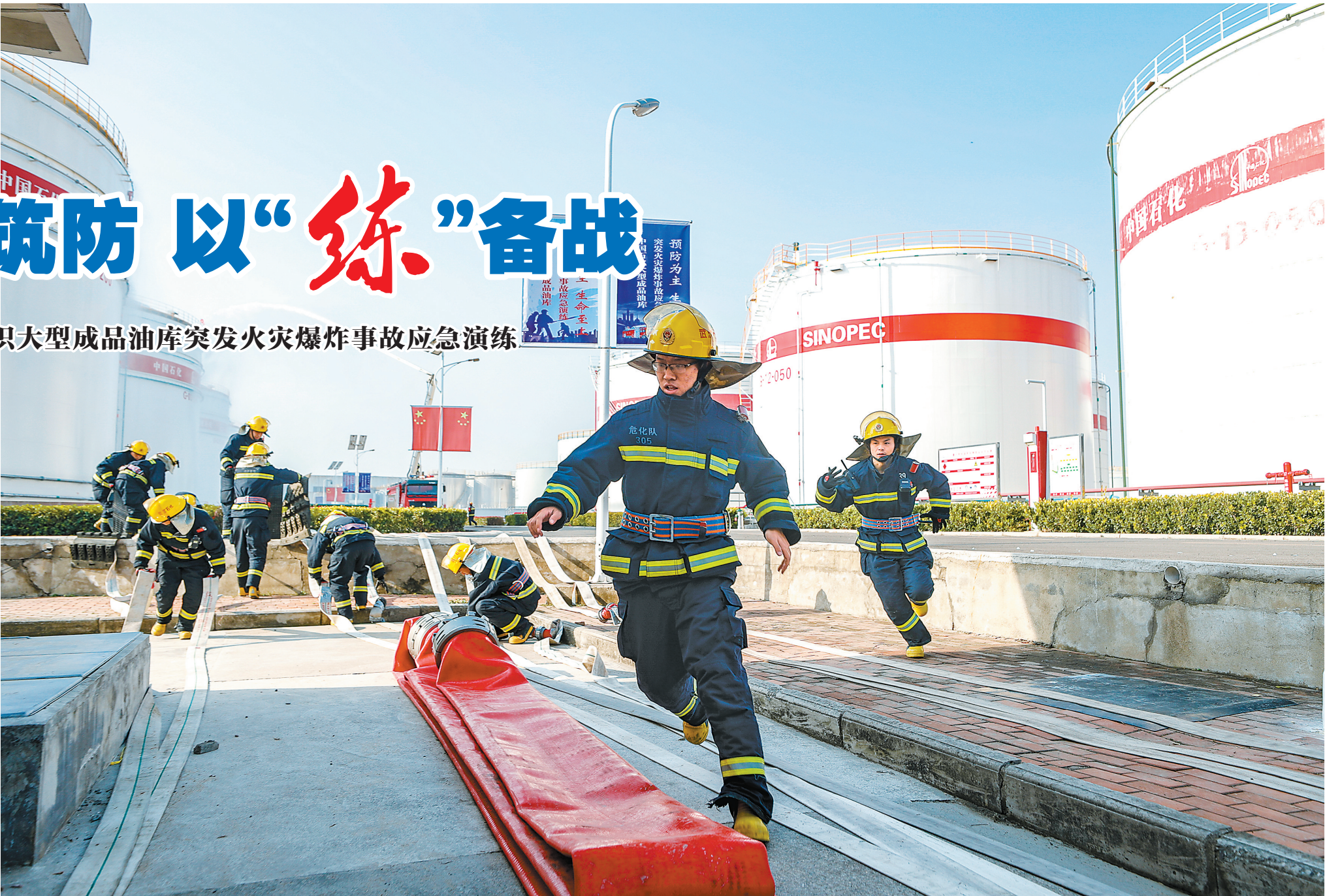
“火情”发生后,作为增援力量,中韩(武汉)石化应急救援队第一时间抵达现场,紧急铺设远程供水系统和耐高温灭火器人水带。