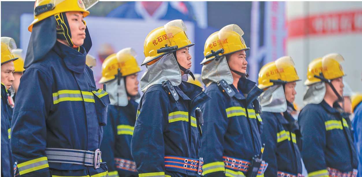
应急救援队员精神抖擞,全程保持紧张的备战状态。