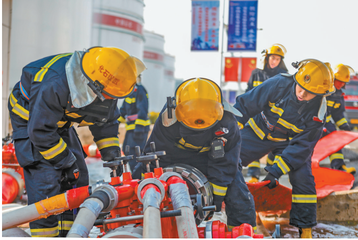
应急救援队员争分夺秒,全速连接远程供水分水器。