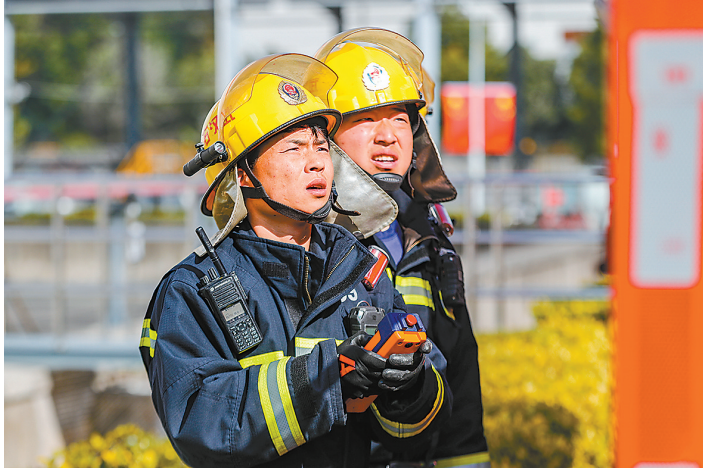
应急救援队员遥控操作拖车炮,进行灭火战斗。