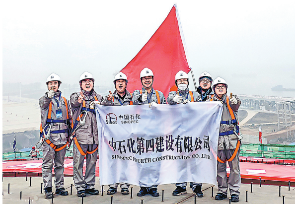
▲2022年12月29日,四建公司完成长江首个内河LNG储罐罐顶升工程。