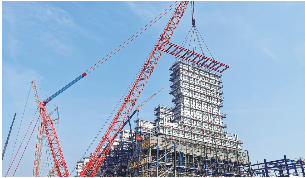
3月27日,四建公司承建的天津南港乙烯项目裂解炉9号炉对流段最后一个模块吊装就位。

惠州、天津石化、海南炼化等多套大型乙烯工程建设任务,多套装置被评为省部级优秀工程;2004年承建的国内首个大型LNG接收站——深圳大鹏16万立方米LNG低温储罐工程获得全国优秀焊接工程奖,此后陆续承建在珠海、山东、天津、芜湖等地的40个LNG工程项目,在焊接工艺和安全质量管控方面走在了行业前列。