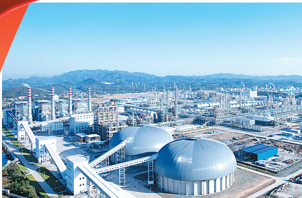
2021年5月,四建公司承建巴陵石化60万吨/年己内酰胺产业链搬迁与升级转型发展项目。