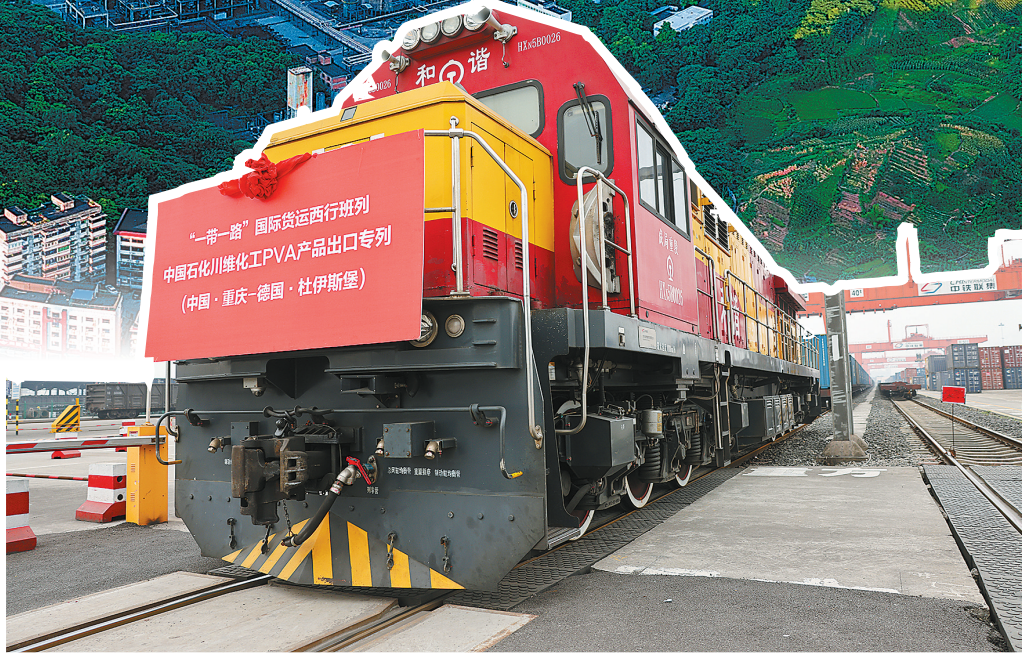
川维化工的产品通过中欧班列专列发往海外市场。