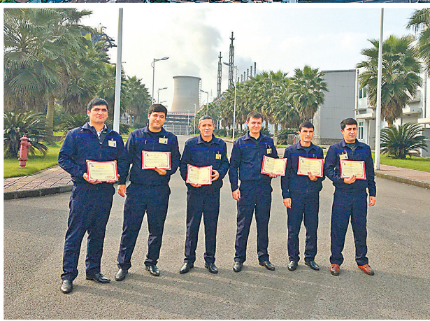
2019年,乌兹别克斯坦纳沃伊公司人员在川维化工完成技术培训。