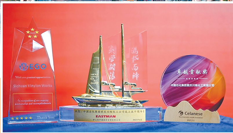
全球日化品和PVA行业龙头企业向川维化工赠送的纪念奖杯。