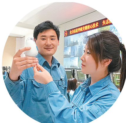
员工查看刚生产的出口级PVA(聚乙烯醇)样品。

一直以来,全世界只有3个国家掌握天然气部分氧化法制乙炔技术,其中工业化装置运行最好且唯一具备万吨级乙炔炉生产技术的企业,只有川维化工。