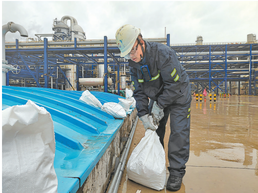
为应对台风“海葵”,古雷石化加大汛期设备隐患排查力度。图为9月2日化工一部员工用沙袋加固雨水池盖板。