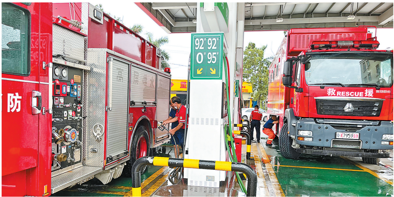
广东石油为1800多辆应急抢险车加油。图为9月2日茂名石油石仔岭加油站员工为救援消防车加油。