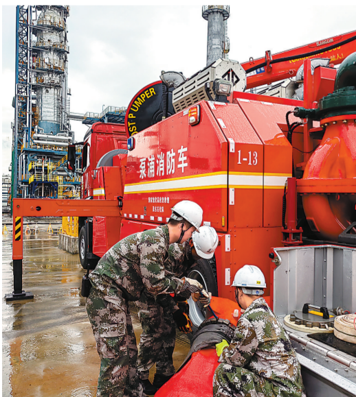
9月2日,茂名地区遭遇暴雨,茂名石化全力做好防汛排涝。图为应急救援中心调动消防车用于低洼区吸水排水。