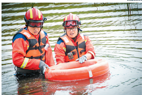
两名抢险队员下到水中调整排水泵位置,清理水泵淤泥。