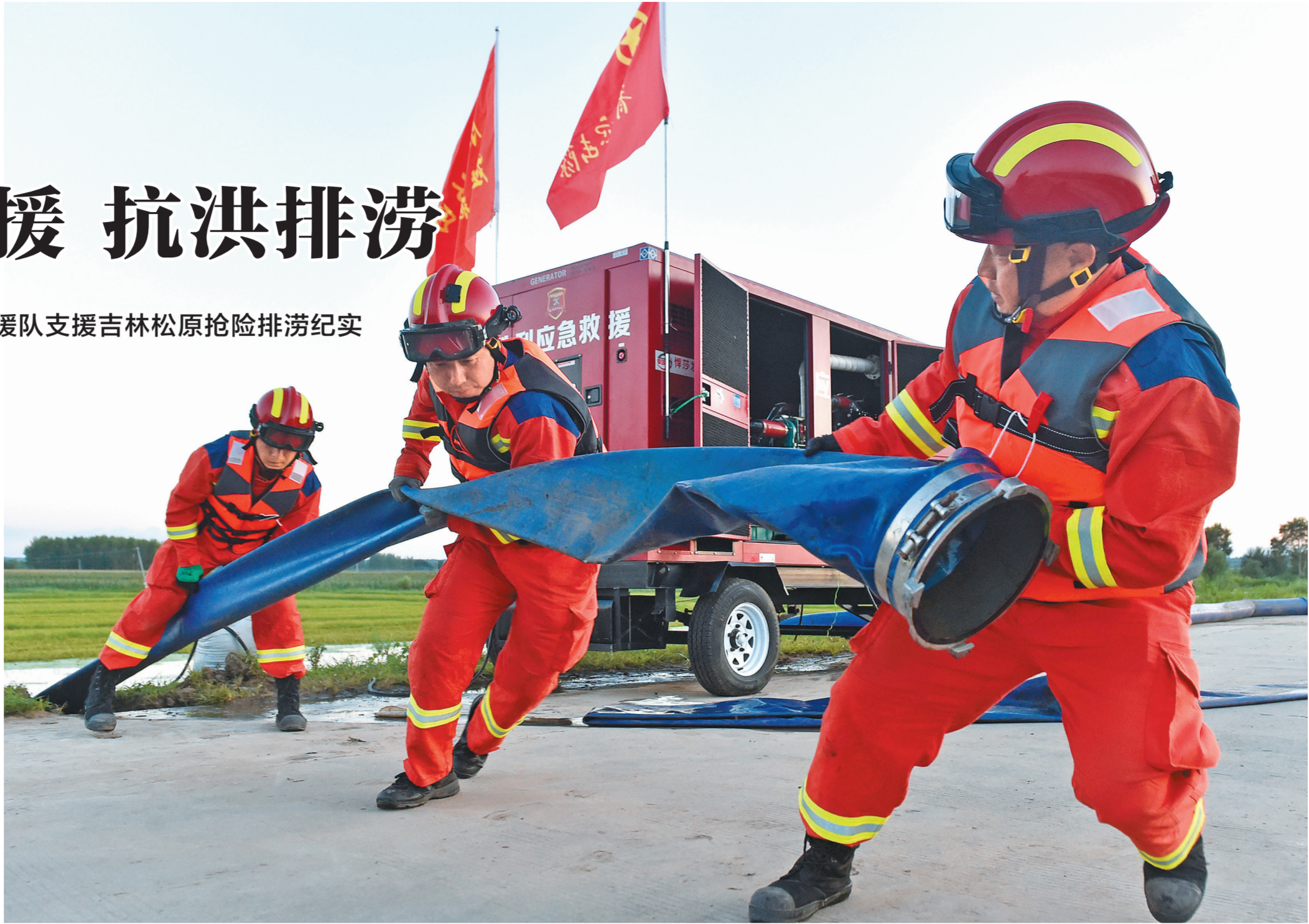
3号排涝点上,抢险队员们相互配合安装排水泵、铺设排水带。

目前,胜利油田救援队已经帮助当地消除了1200公顷农田的水患,帮助6个村庄道路恢复通行。排涝抢险工作仍在有序进行,大家力争用最短时间完成农田及村落积水排涝任务,助力农田复耕,让居民早日回家。