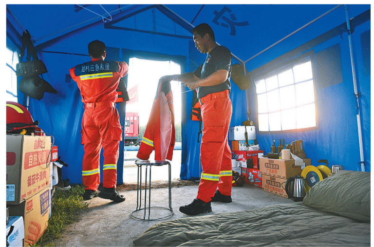
救援队在外坚持军事化管理,简易休息处的内务井井有条。