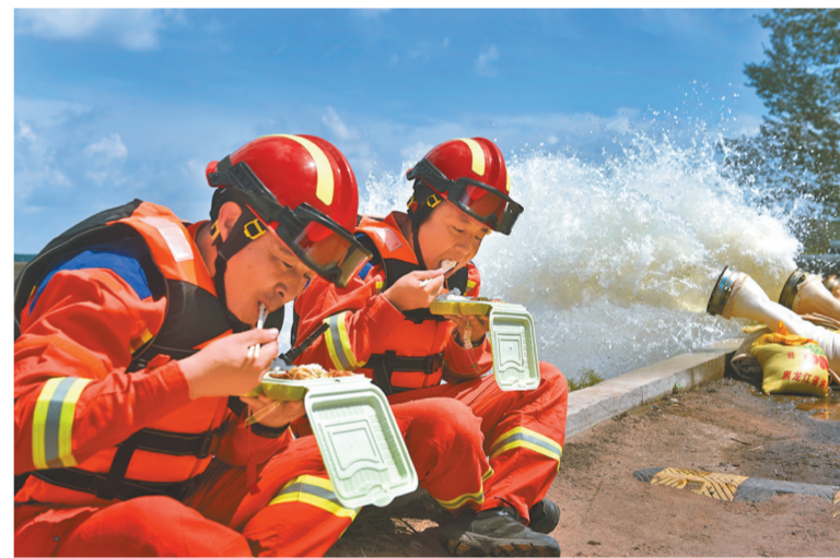
抢险队员坐在堤坝上用餐,随时关注着旁边的排水管。