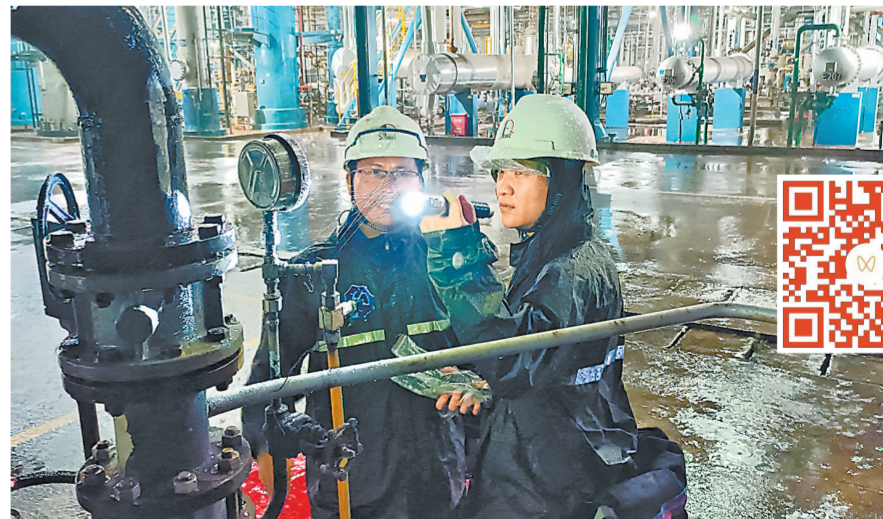
7月17日,茂名石化炼油分部员工在雨中巡检。