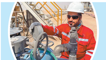
●伊 萨/口述 杨光威 赵书凝 文/图