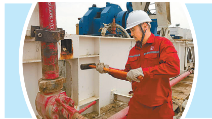
●马杰提/口述 刘建柱 文/图