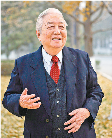
2013年第一届“感动石化”人物——中国科学院院士、中国工程院院士闵恩泽