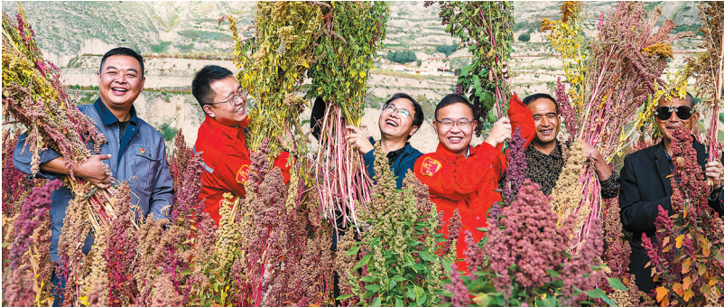
2021年第六届“感动石化”团队——东乡扶贫团队

细细品味《感动石化》,会发现“感动石化”人物是我们企业在新时代坚守初心最美的一群人。自身强大才能铸造理想,作为新时代青年,应坚守初心,不断进步、不停脚步,才能奔向更美好的未来。我在销售企业基层工作,解决一线服务中的痛点、难点,把一件件小事办好、实事办成、好事办到位,切实做好服务群众的“螺丝钉”,便是我的责任与方向。