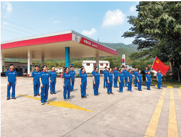
2021年第六届“感动石化”团队——广东石油佛山南海一党支部