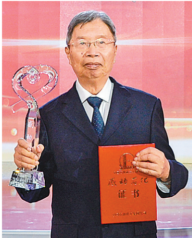
2018年第四届“感动石化”人物——中国科学院院士陈俊武