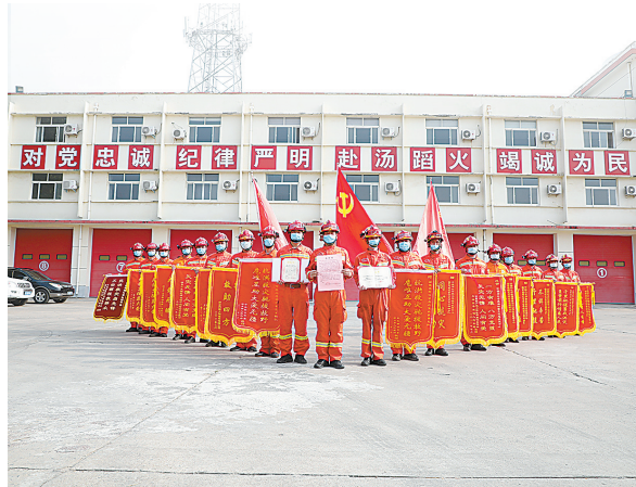
2019年第五届“感动石化”团队——中原油田普光应急救援中心